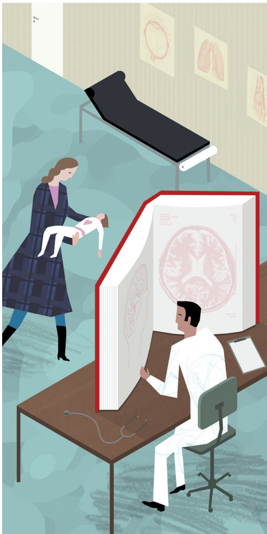
Illustrasjon Svein Størksen

Mottatt 28.4. 2011 og godkjent 18.8. 2011. Medisinsk redaktør Anne Kveim Lie.