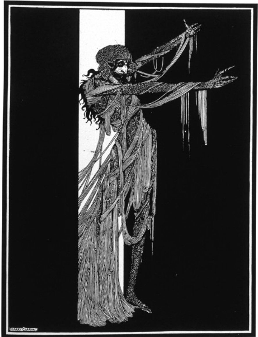
Figur 1 Lady Madeline i The fall of the house of Usher . Illustrasjon Harry Clarke.

Et tankevekkende poeng er at katalepsi, som Poe oppfattet som «fatal» og «a species of epilepsy» ( Berenice ) tilsynelatende er forsvunnet. Den tilstanden som Poe og mange andre forfattere i det 19. århundret oppfattet