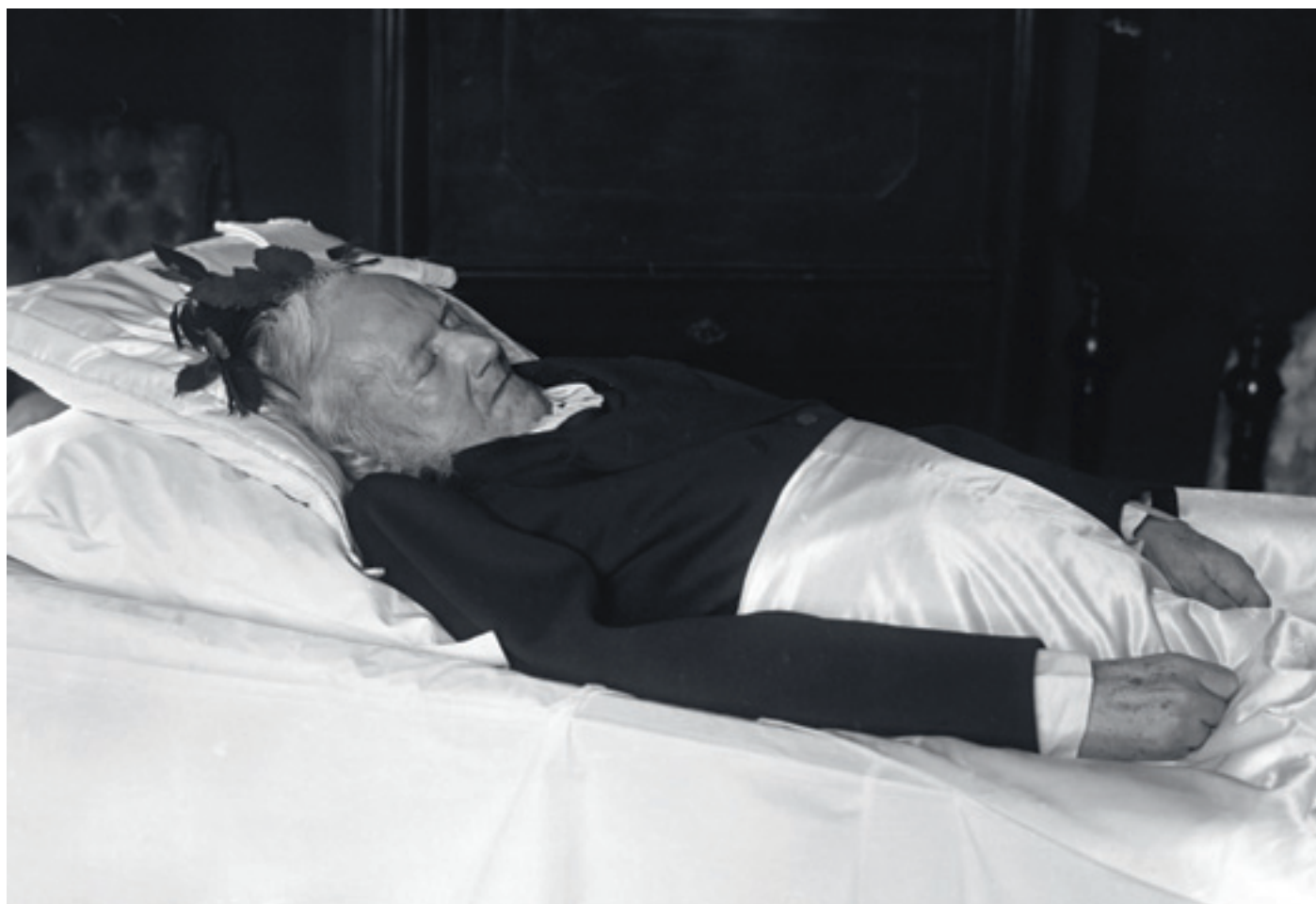
Figur 3 Etter at Ibsen var død, ble fotografen Anders Beer Wilse (1865–1949) tilkalt for å ta de siste bilder av dikteren hjemme i stuen i Arbiens gate.

Om Ibsens plagsomme søvnløshet bunnet i hans hjertesvikt, vet vi ikke, men lærebøkene omtalte søvnløshet som et symptom hos hjertepasienter som kunne kreve behandling. Behandlingen var den samme som for søvnløshet i sin alminnelighet. Dersom de alminnelige «hygienisk-diætetiske foranstalt-