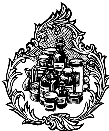
Illustrasjoner Johs Mjeldheim

Noen tro på «Draaber og Pulvere» har han ikke. De virker kun hvis pasienten har «en sterk Troe og Imagination med en særdeles