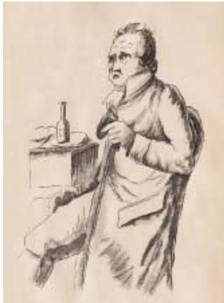
«Bellmans morgonssup», dikteren kan kanskje være mer treffende portrettert her enn i Pehr Kräfteffs offisielle oljemaleri. Samtidig tegning utført av Johan Tobias Sergel (15)