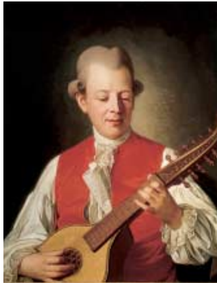
Oljemaleri av Carl Michael Bellmann, utført 1779 av Pehr Krafft d.e. på oppdrag fra Gustaf III. Bildet henger i Sveriges Nationalmuseum. Gjengitt med tillatelse

Men, nej nej, aldrig denna tunga En enda dropa mer förmår, Hon knappast väser fram: «Gutår!» För'n kölden stelnar blod och lunga Och benen domna i min bädd: Min hand blir is och näsan vatten, Min fot som glas, och hela natten Regerar själen yr och rädd.