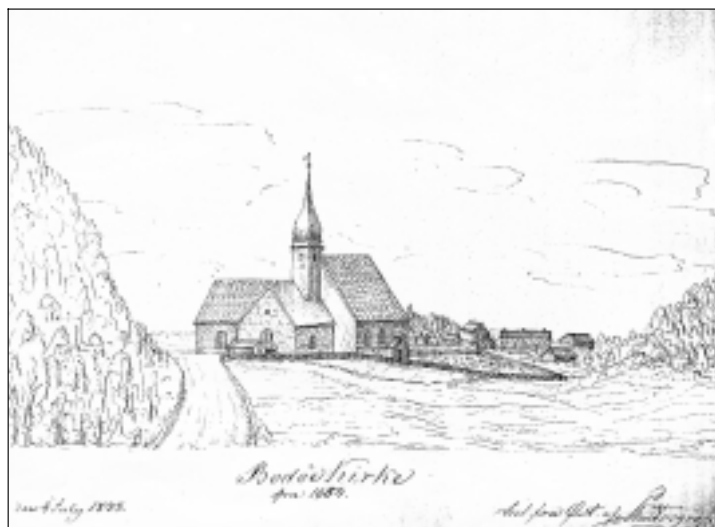
Figur 1 Bodin kirke er en steinkirke fra 1200-tallet. Til høyre preste-gården.

Først i 1803 ble de autoriserte legene pålagt å ta hånd om de syke i stedet for prestene. Og fra nå av skulle legene innrapportere medisinalforhold til de sentrale myndigheter (1).