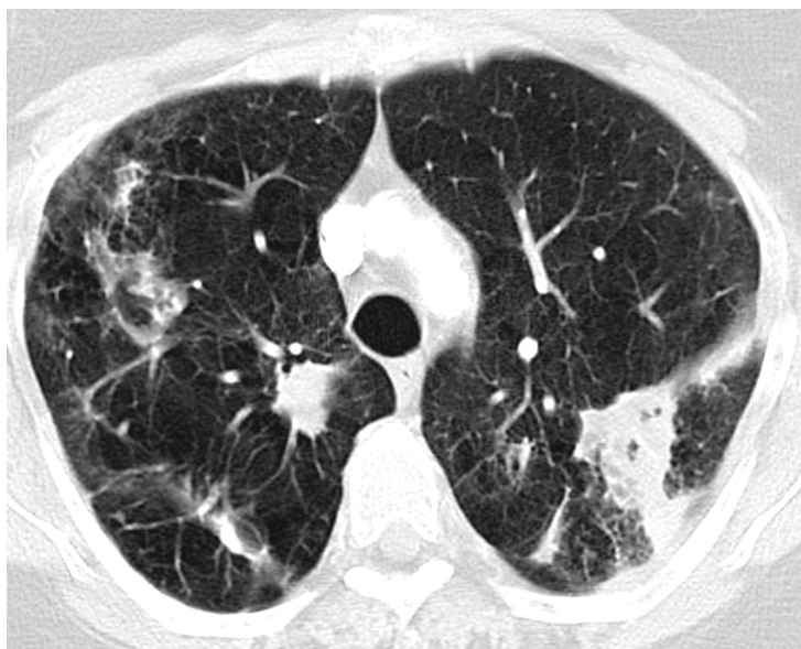
Figur 1 CT thorax av en pasient med alvorlig kols med emfysem. Det ses kavernøse og fibrotiske forandringer samt infiltrater. Det var gjentatt oppvekst av M. intracellulare i luftveisprøver.