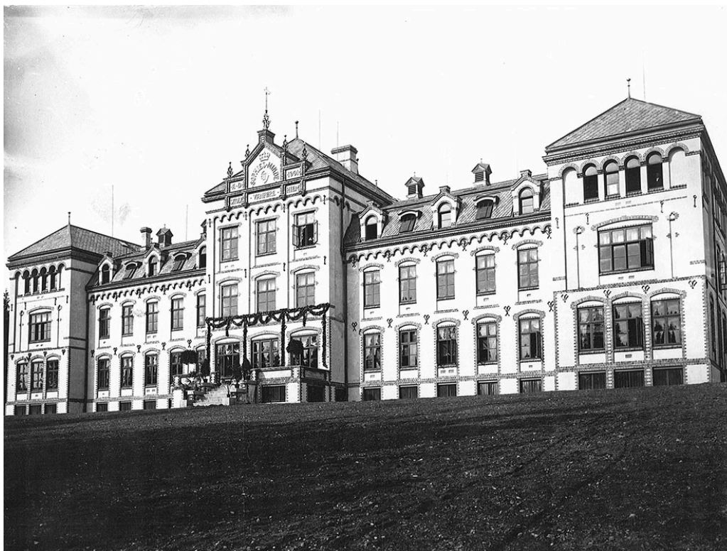
Sophies Minde sykehus, ved åpningen i 1902.