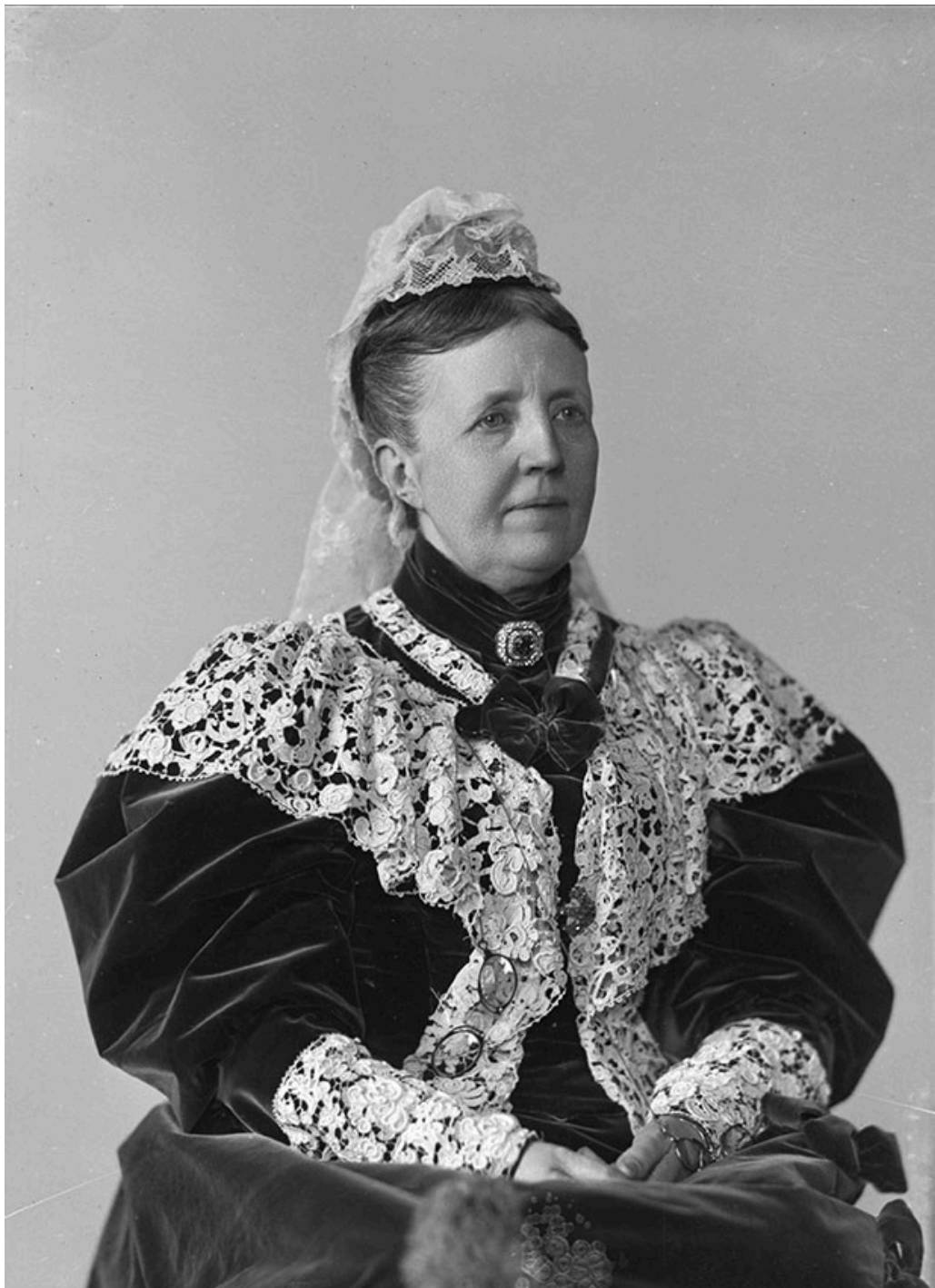
Dronning Sophie (1836–1913), ca. 1910.

Etter krigen møter vi sosialdemokratiets tro på rasjonalitet, sentralisert stordrift og vitenskapelig begrunnet inngripen i folks dagligliv, bosituasjon, arbeidsliv og kropper. Det er særlig i disse årene, kjent som Gerhardsenepoken, at sykehuset satte i gang å operere for alvor.