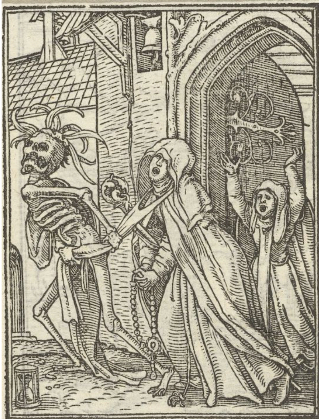
Figur 6 Hans Holbeins Dødsdans (1523–25). Danse macabre var et kunstnerisk symbol på dødens allmenngyldighet (9), som Foucault knytter til skiftet i Europas forhold til død, galskap og moral. I offentlig eie

staten nå makten til å gripe inn. Nyere forskning har vist at mange alvorlige sinnslidelser utvikler seg gradvis, gjennom langvarige prodromale faser der subtile tegn kan varsle begynnende forverring. Denne forståelsen, sammen med økt kunnskap om genetisk sårbarhet, har gitt grunnlag for tidligere intervensjoner i sykdomsforløpet av psykiske lidelser. Der man tidligere fryktet den latente galskapen i enhver person, har man nå myndighet til å treffe tvangsvedtak i en begrenset populasjon som står i fare for å bli alvorlig psykisk syke. Dette tillater bruk av tvang ikke bare ved manifest galskap, men også til yngre pasienter i tidlige sykdomsfaser eller personer med kjente psykiske lidelser som står i fare for forverring.