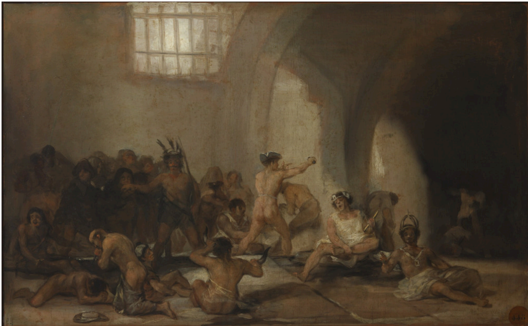
Figur 5 Francisco Goyas maleri Casa de locos (1812–19). Scenen skildrer Foucaults bilde av galskapen som innelåst og fratatt både frihet og språk, men samtidig bundet fast til statens urokkelige institusjonelle makt. I offentlig eie, via Wikimedia Commons (7)

«De alvorlig psykisk syke lever, i likhet med seilerne på narrenes skip, med en illusjon av frihet»