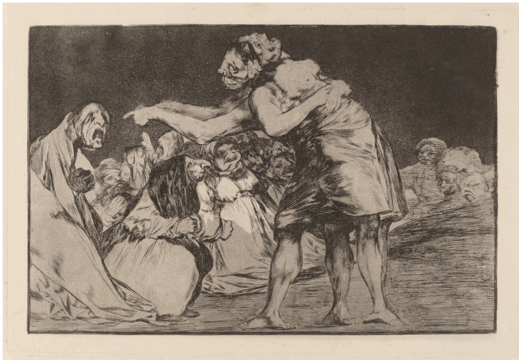
Figur 4 Francisco Goyas etsning Disparate desordenado (1815–23). «[Goya] vender seg mot en annen galskap. Ikke mot den som rammer de gale som kastes i fengsel, men som rammer det mennesket som er kastet ut i mørket» (1, s. 183). National Gallery of Art, i offentlig eie