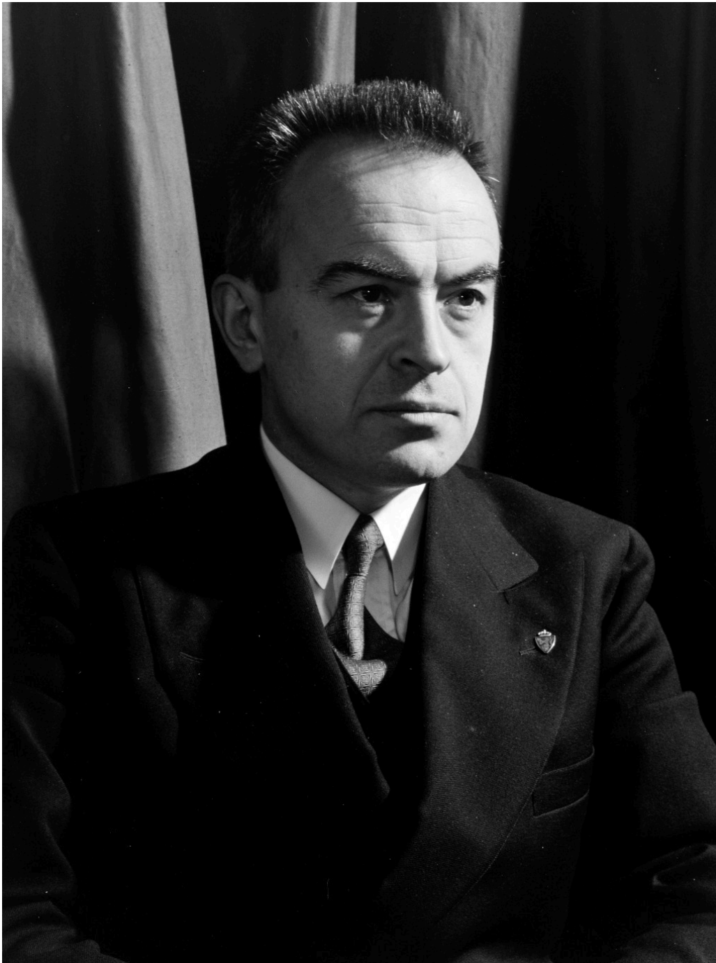
Figur 3 Medisinaldirektør Karl Evang ved Medisinaldirektoratet i London i 1943 (16). Som helsedirektør i eksilregjeringen var han en av de mest sentrale aktørene i arbeidet med å skaffe penicillin til det okkuperte Norge.

«Vi mottar av og til forespørsler hjemmefra om muligheten for å skaffe penicillin til bestemte tilfeller. Således fikk vi nylig en slik anmodning om penicillin til en mann som hadde multiple osteomyelitter etter beskadigelse ved en landmine. Vi fikk da overlatt en porsjon av den svenske medisinalstyrelse.»