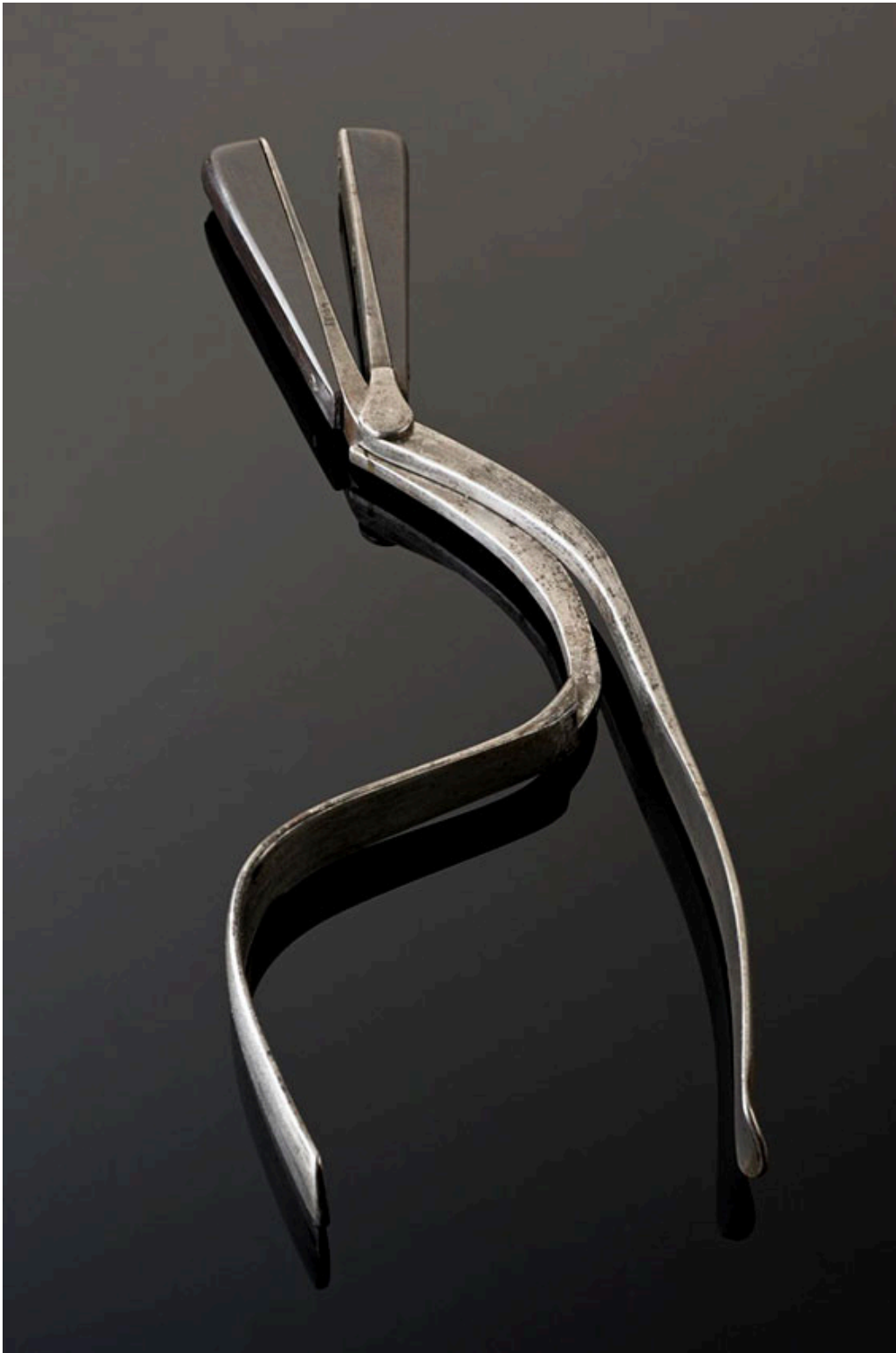
Figur 2 Et annet av eksemplarene av Sandborg-Vedeler's tang i Science Museum i London (33). CC BY-NC-SA 4.0.