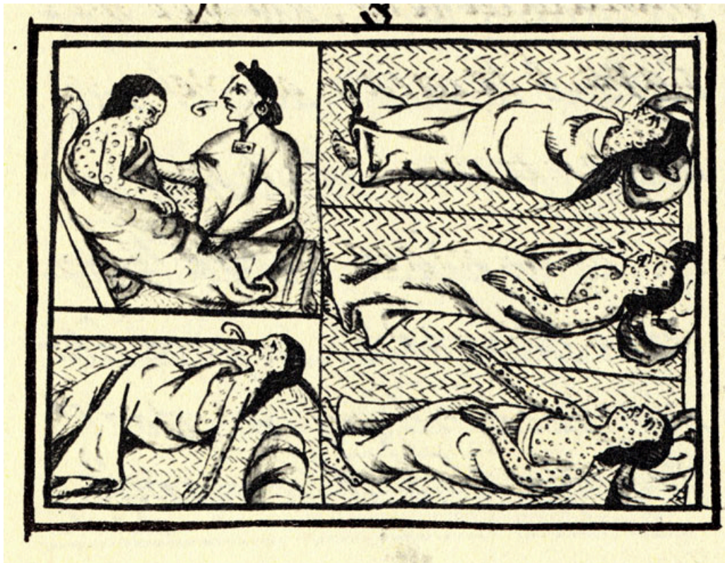
NAHUA-FOLKET SMITTET AV KOPPER: Spredning av epidemiske sykdommer hadde katastrofale følger for befolkningen i «Den nye verden» etter europeernes ankomst i

Kennedy går i sin bok i dialog med Diamond, men hevder at han ikke i tilstrekkelig grad anerkjenner mikrobenes rolle som den avgjørende drivkraften. Diamond peker på viktigheten av tilgang til stål og andre naturressurser i en samfunnsmessig og kulturell kontekst som fremmet innovasjon og utvikling, mens Kennedy hevder at mikrobenes rolle alene forklarer historiens gang. Jeg har vanskeligheter med å følge denne argumentasjonen. Bølgene av pestsykdom forårsaket av Yersinia pestis fra antikken og langt inn i nyere tid har åpenbart hatt dramatiske konsekvenser for økonomi, militære maktbalanser og den generelle samfunnsorden. Spredningen av mesling- og koppevirus i Den nye verden (Amerika) desimerte uten tvil azteker- og inkariket. Den høye forekomsten av gulfeber og malaria gjorde det umulig for europeiske bosettere å kolonisere tropiske strøk i Afrika. Det hindret imidlertid ikke den transatlantiske slavehandelen, og det ble til og med kostnadseffektivt å benytte slaver av afrikansk opprinnelse på sukker- og tobakksplantasjene i Karibien og på det amerikanske fastlandet.