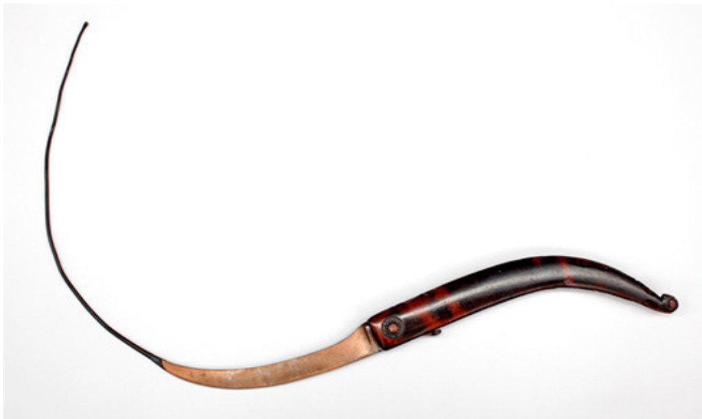
Figur 2 Dette er instrumentet – en skalpell med kongelig kurvatur – som ble utviklet for å operere Ludvig 14.