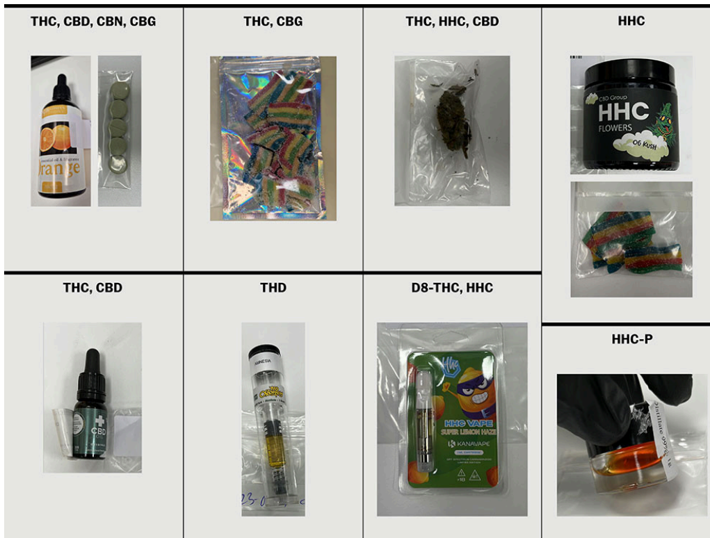
Figur 2 Eksempler på semisyntetiske cannabinoider beslaglagt av Tolletaten i Norge.

Likevel har vi indikasjoner på at semisyntetiske cannabinoider brukes også i Norge. Kripas meldte både i 2023 (10) og 2024 (11) om beslag av heksahydrocannabinol og \Delta^8 -THC (figur 2). Disse alternativene til cannabis er ofte billigere (5). De kan inntas som væsker til e-sigaretter og spiselige produkter eller finnes tilsatt i andre cannabisprodukter (12).