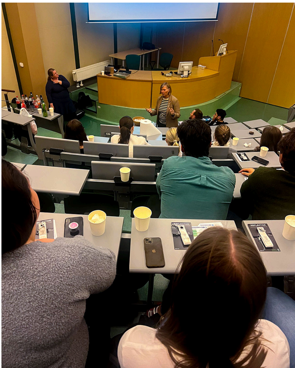
FREMTIDEN: Tilhørerne fulgte godt med når seniorlegene fortalte om sine erfaringer fra livet som lege.

Gjennom tre hektiske dager møter vi om lag 150 norske studenter. Kanskje ikke det største antallet, men det får deg til å tenke: Hva gjør Legeforeningen så vellykket? Hvorfor har vi en oppslutning på 93,5 prosent av alle yrkesaktive leger i Norge? Svaret ligger nettopp i de små, jevne stegene og møtene.