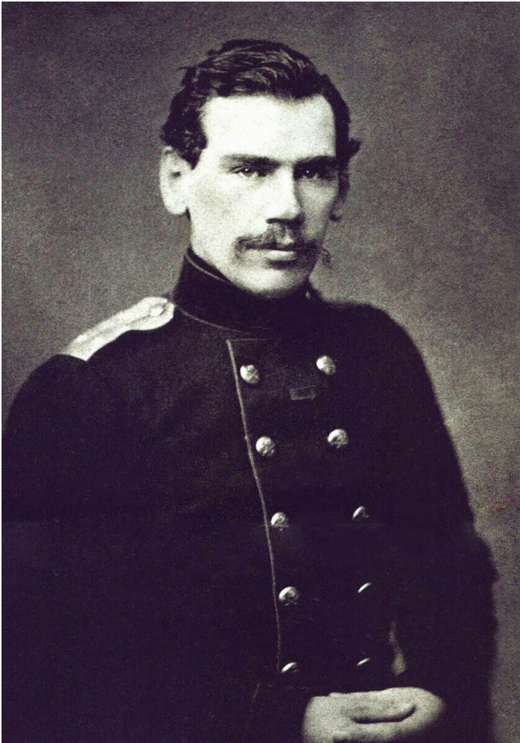
Tolstoj i militær uniform, 1856.

Menneskets grunnvilkår er brutale. Våre liv kan være korte eller lange, men ender uansett med døden. Vi kan bli syke eller utsettes for ulykker. Vi vet ikke hvorfor vi er her, og heller ikke hva som skjer når vi dør. Hever vi blikket og ser tilværelsen i et historisk perspektiv, blir denne realiteten enda tydeligere: Forventet levealder i antikken var trolig bare litt over tjue år. Barnedødeligheten var enorm – den romerske keiseren Marcus Aurelius (121 e.Kr.–180 e.Kr.) hersket over store deler av verden. Han fikk fjorten barn, men bare fem av dem nådde voksen alder (1) . Så sent som da min bestefar ble født, var forventet levealder for menn i Norge 52 år (2) . På den tiden døde om lag syv