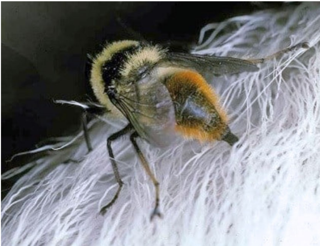
Figur 2 Reinbrems ( Hypoderma tarandi ) legger egg via eggledere langs hårstråene i reinsdyrpels.

Reinbrems har et humlelignende utseende og finnes i områder hvor det lever reinsdyr. Den legger egg langs hårene i pelsen på reinsdyr i sommermånedene via egglederne i bakenden (figur 2). Etter klekking kryper larven, som er omtrent 0,6 mm stor, gjennom huden på dyret og slår seg etter hvert til ro i underhuden med et pustehull i huden. Gjennom vinteren vokser den til en larve på 2–3 cm før den i mai/juni forlater verten, forpuppes og blir til en voksen reinbrems (8).