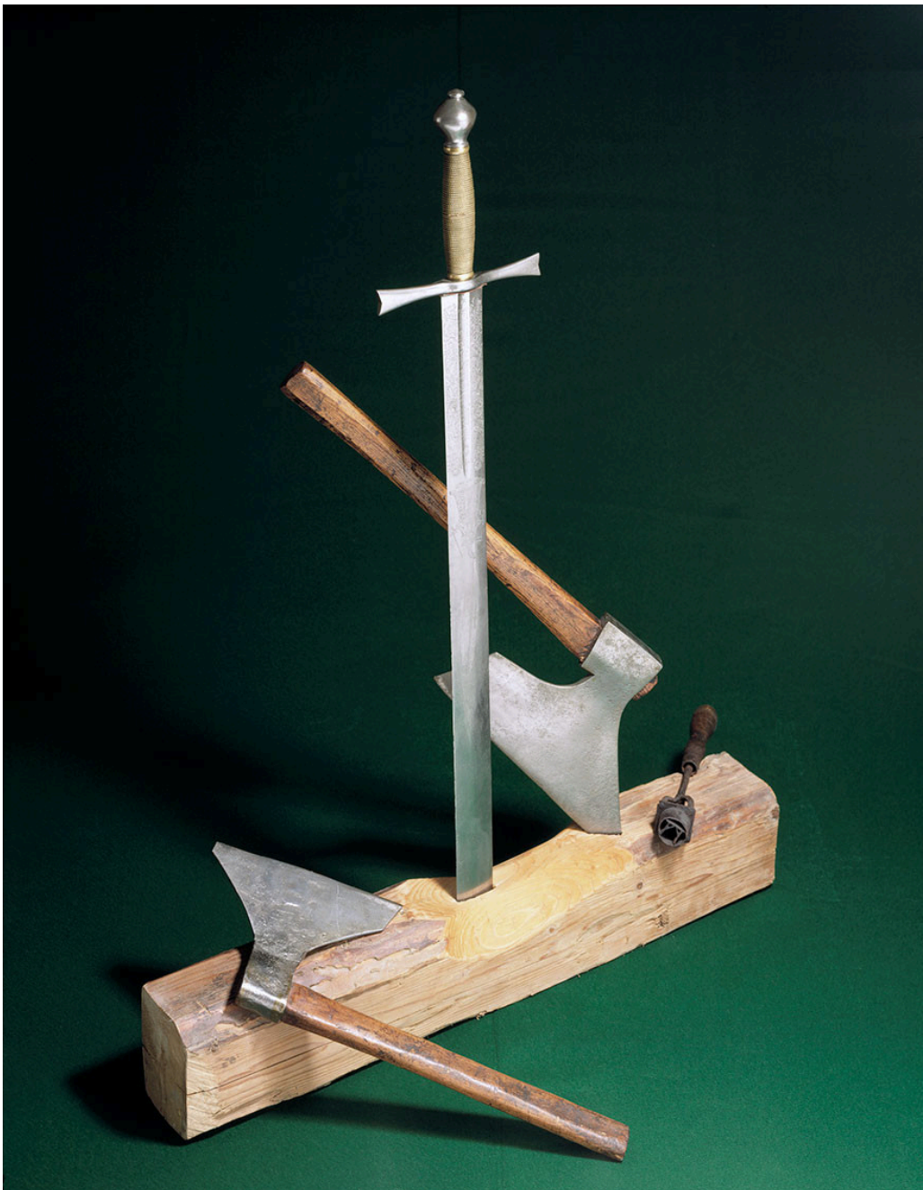
Figur 3 Skarpretterutstyr som har tilhørt familien Lædel.

«Hvis Lædel faktisk hadde bradykinesi, vil det kunne forklare at hvert hugg fikk mindre høyde og påfølgende mindre kraft»