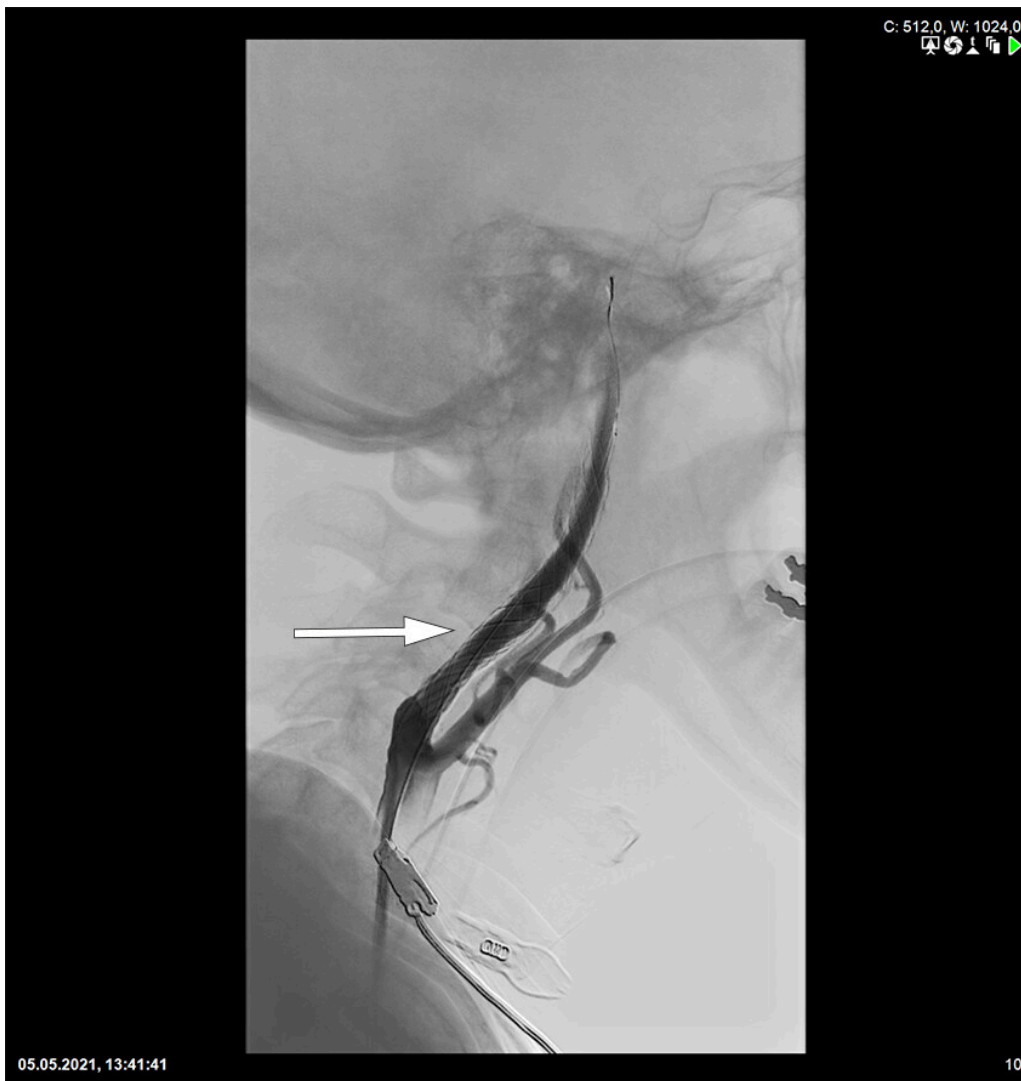
Figur 3 Stent plassert i a. carotis interna.

Cerebral CT utføres på angiografibordet rett etter prosedyren. Prosedyrerelatert subaraknoidalblødning påvises hos rundt 3–5 % (23, 24). Reperfusjonsblødning, fra mindre petekkiale blødninger til større hematomer, ses relativt hyppig, men under 5 % av blødningene medfører økte nevrologiske utfall (8). Fragmentering av tromben med embolisering lenger distalt, eller til et annet kargebet, forekommer også. Sjeldnere komplikasjoner er arteriell perforasjon eller disseksjon. Dødsfall i direkte forbindelse med prosedyren ses meget sjelden.