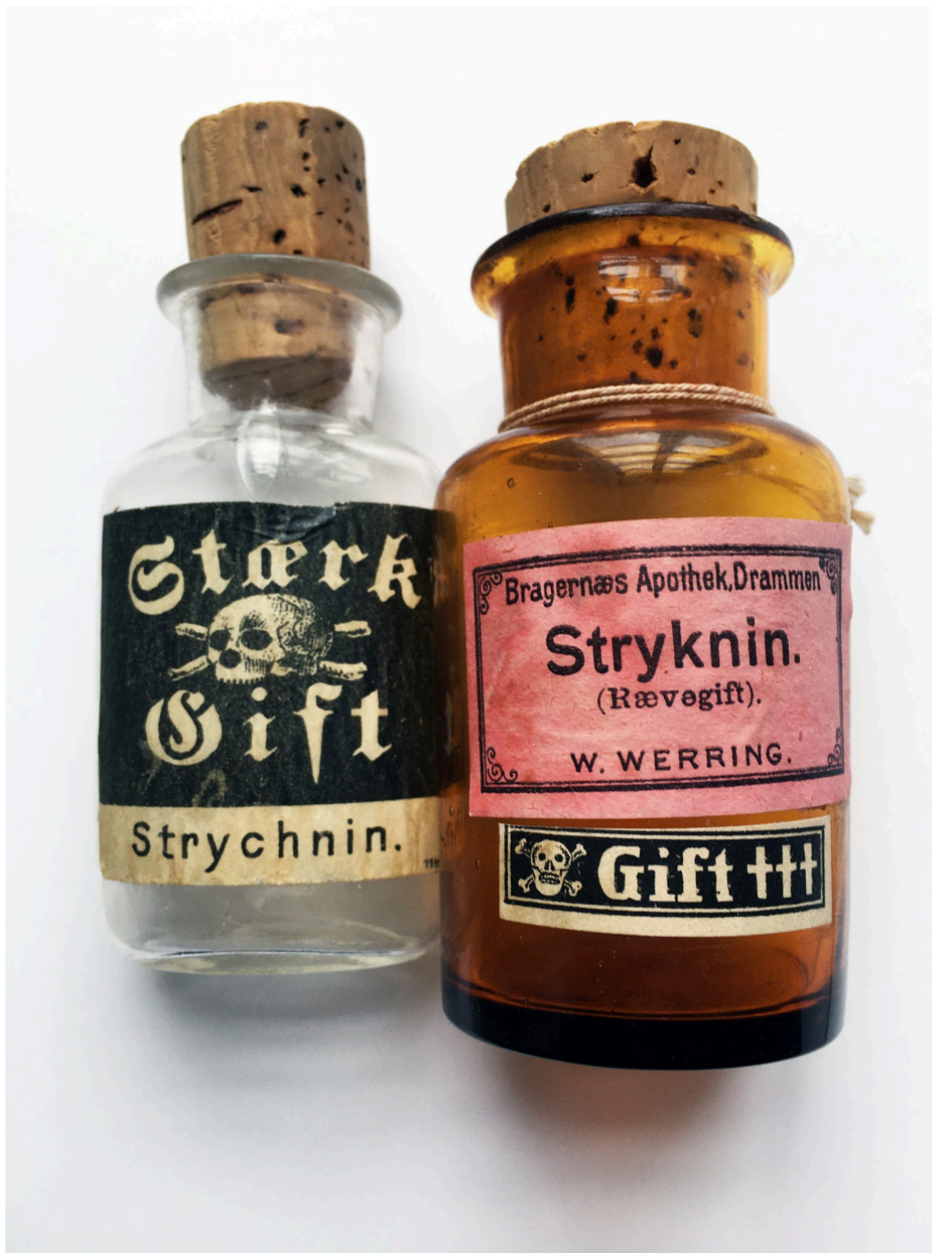
Figur 3 Strykninglass fra 1920- (venstre) og 1940-årene (høyre).

Fatal dose for en voksen angis gjerne til 50–100 mg stryknin, men dødsfall har forekommet etter inntak av så lite som 5–10 mg (14, 15). Stoffet er luktfritt, men smaker fryktelig bittert (16). Stryknin er en selektiv, kompetitiv antagonist til glysin, en inhibitorisk neurotransmitter, særlig i ryggmargens motoriske forhornceller og i hjernestammen (17, 18). Tidlige symptomer oppstår gjerne 15–30 minutter etter peroralt inntak av stryknin, med engstelse, muskelpasmer og hypersensitivitet for stimuli.