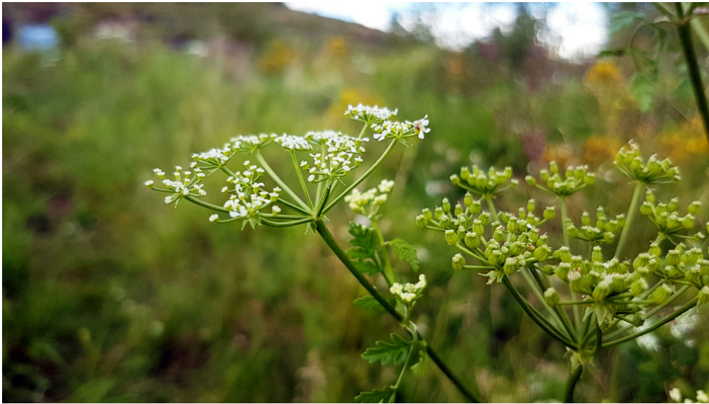
Figur 1 Gifstkjeks.

Forgiftningsforløpet kan være todelt, med en innledende stimulerende fase preget av hypertensjon, takykardi, oppkast, diaré og kramper, som skyldes aktivering av reseptorene. Videre blokade av reseptorene fører til en vedvarende depolarisering, med en påfølgende dempende fase med hypotensjon, bradyarytmi og etter hvert koma, paralyse, respirasjonssvikt og død (9). Symptomer kan oppstå så tidlig som 15–30 minutter etter peroralt inntak (10).