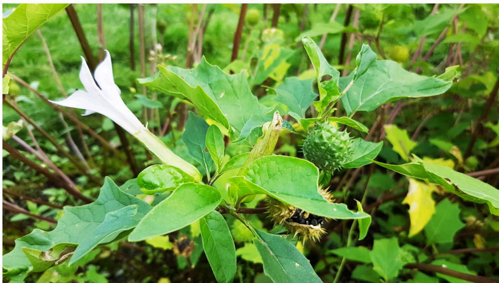
Figur 5 Piggeple ( Datura stramonium ).