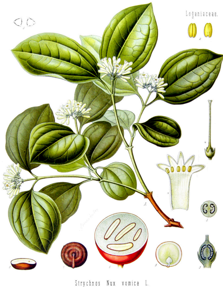
Figur 2 Illustrasjon av brekknøttetreet ( Strychnos nux-vomica ). Fra Köhler's Medizinal-Pflanzen in naturgetreuen Abbildungen mit kurz erläuterndem Texte: Atlas zur Pharmacopoea germanica

Stryknin er et svært giftig alkaloid som finnes i flere arter av planteslekten Strychnos , eksempelvis brekknøttetreet ( Strychnos nux-vomica ) (figur 2). Brekknøttetreet vokser i varme deler av Asia, Amerika og Afrika (13). I Norge ble stryknin tidligere solgt på apotek, til bruk i åte mot rovdyr som rev, jerv og ulv, og mot rotter (figur 3). Stryknin forekommer i enkelte skadedyrmidler og er også rapportert i noen urtemedisiner (14).