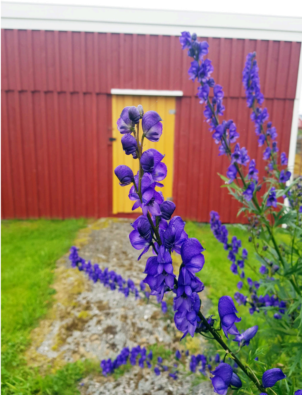
Figur 6 Art i hjelmslekten ( Aconitum ).

Hjelmslekten ( Aconitum ), også kalt «alle gifters dronning», består av mer enn 300 plantearter (38) (figur 6). De vakre plantene storhjelms ( Aconitum napellus ) og oktoberhjelms ( Aconitum carmichaelii ) finnes i flere hager, mens tyrihjelms ( Aconitum septentrionale ) vokser vilt i det meste av Norge, særlig i fjelltrakter. Mange hjelmsplanter selges i blomsterbutikker, også som buketter.