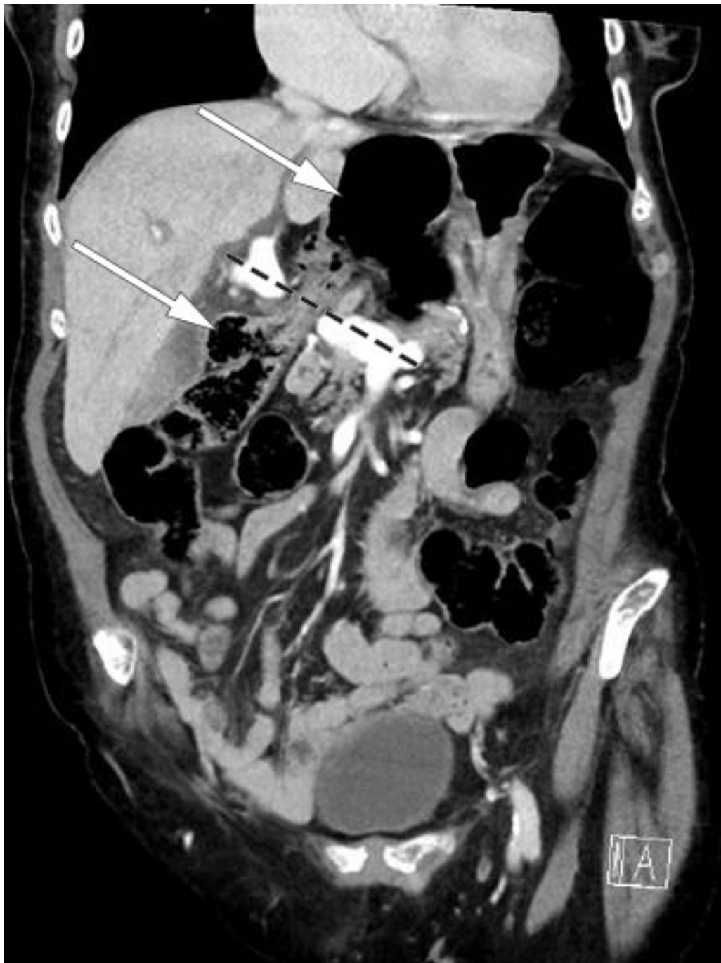
Figur 1 CT av buken, aksialplan. Pilene peker på cøcum som er herniert gjennom Winslows foramen og ligger som en luftfylt tarmslyng i epigastriet. Den stiplede linjen markerer ligamentum hepatoduodenale, hvor det er vena portae som er kontrastladende på dette bildet. Tynntarmen er dilatert, og ventrikkelen er sammenfalt.

Pasienten hadde altså en spontan og sjelden form for intern herniering som forårsaket tarmslyng. På bakgrunn av kliniske undersøkelser og CT-funn ble det funnet indikasjon for operativ behandling. Pasienten ønsket i første omgang ikke kirurgi. Hun ble lagt på kirurgisk sengepost med ventrikkelsonde og intravenøs væsketilførsel samt smertelindring med morfin, med varierende effekt. På dette tidspunkt var hun mindre utspilt i buken og ikke lenger palpasjonsøsm i epigastriet. Dermed var det ikke mistanke om truet tarm, og det ble ansett som trygt å observere pasienten videre. Ved kontroll av blodprøver var CRP fortsatt 4 mg/L, leukocytter steget til 14,7 \times 10^9/L og venøs laktat 4 mmol/L ( < 2,5 ). Ett døgn etter innleggelsen samtykket pasienten til kirurgi, etter gjentatte samtaler med kirurg. Hun ble operert morgenen etter med