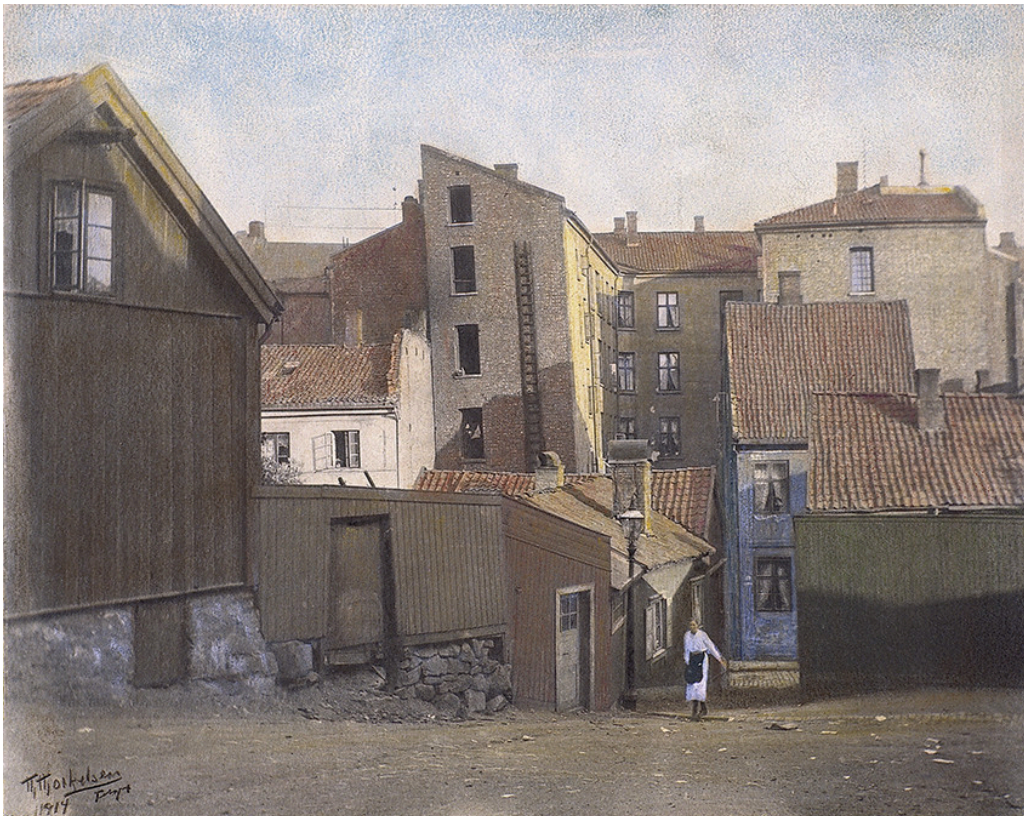
Figur 1 Forstaden Pipervika, hvor det var billig å bo, ble et vanlig sted å losjere for studentene på 1800-tallet. Dette fargelagte fotografiet viser Strandbakken, hvor Oslo Rådhus står i dag.