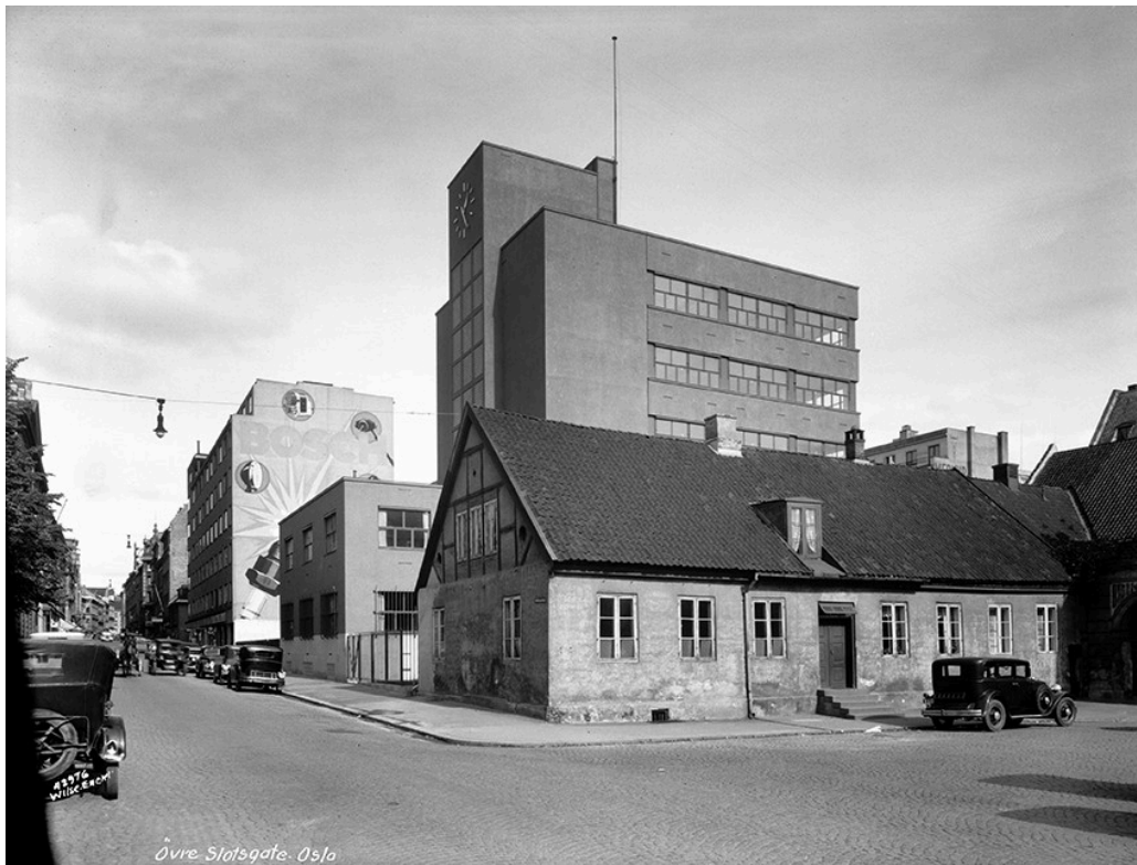
Figur 3 «Anatomigården» (Rådhusgaten 19), byens eldste bindingsverkshus, var i bruk for medisinsk undervisning fra oktober 1815 og til det nye universitetskomplekset på Karl Johan sto ferdig til innflytting i 1852. Tidligere kalt «Brennerigården» på grunn av et geneverbrenneri som holdt til her. Foto: Wilse / Oslo Museum (1935).

Det medisinske miljøet var som nevnt begrenset. Det gjaldt ikke minst tilgangen til lærebøker. Noen av forelesningsnotatene som er bevart fra denne første tiden (8), viser hvor nøye studenten måtte skrive ned alt for å sikre seg stoff til de obligatoriske fagene som ble forelest: encyklopedi, medisins historie, anatomi og fysiologi, diettlære, patologi og terapi, farmakologi og reseptlære, kirurgi og fødselsvitenskap, rettsmedisin og «Sundhedspolitie», som nærmest kan oversettes med hygiene (9). Noen egentlig studieplan fantes ikke, og klinisk undervisning ble først mulig etter at Rikshospitalet åpnet i 1826 (10).