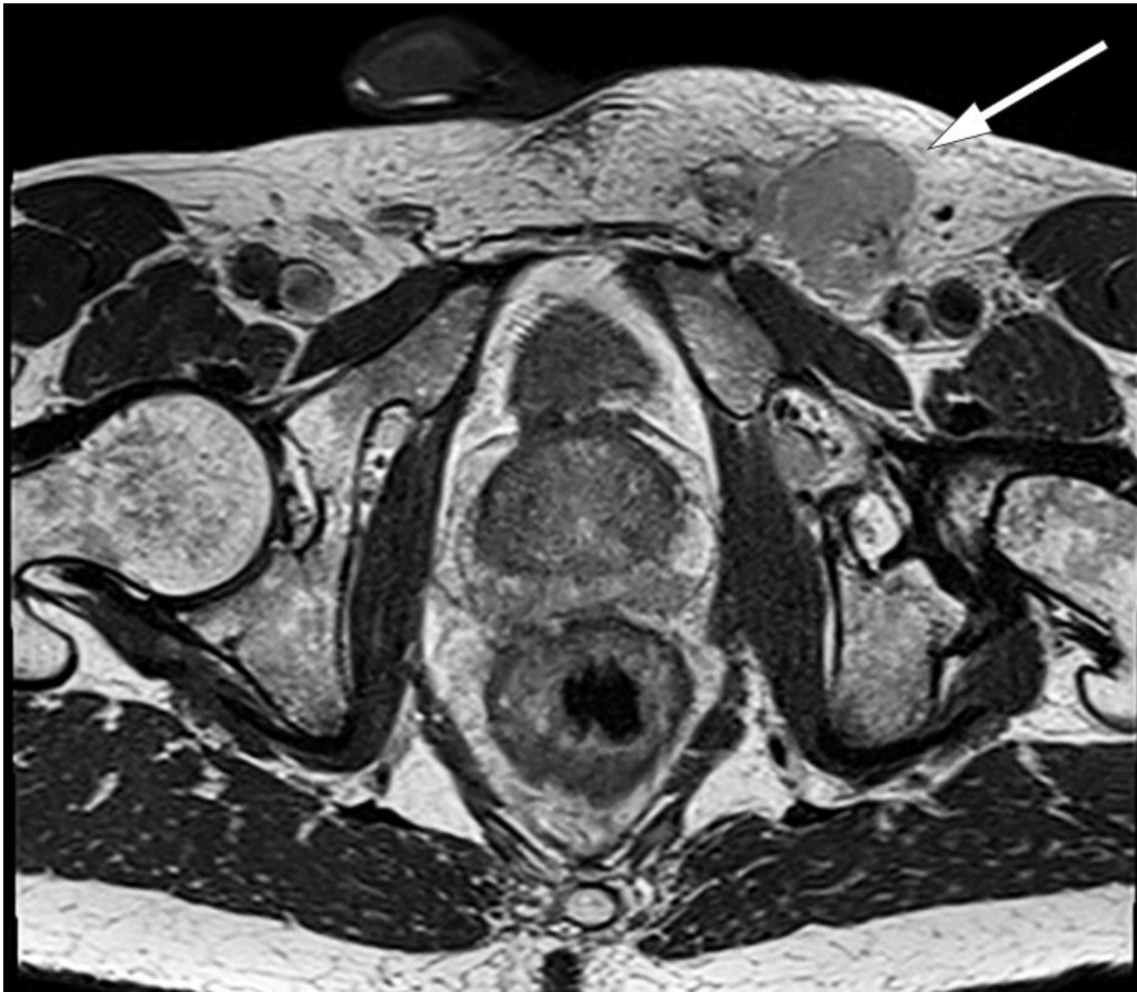
Figur 2 MR-bilde, aksialsnitt av bekken. Forstørret lymfeknute i venstre lyske (pil).