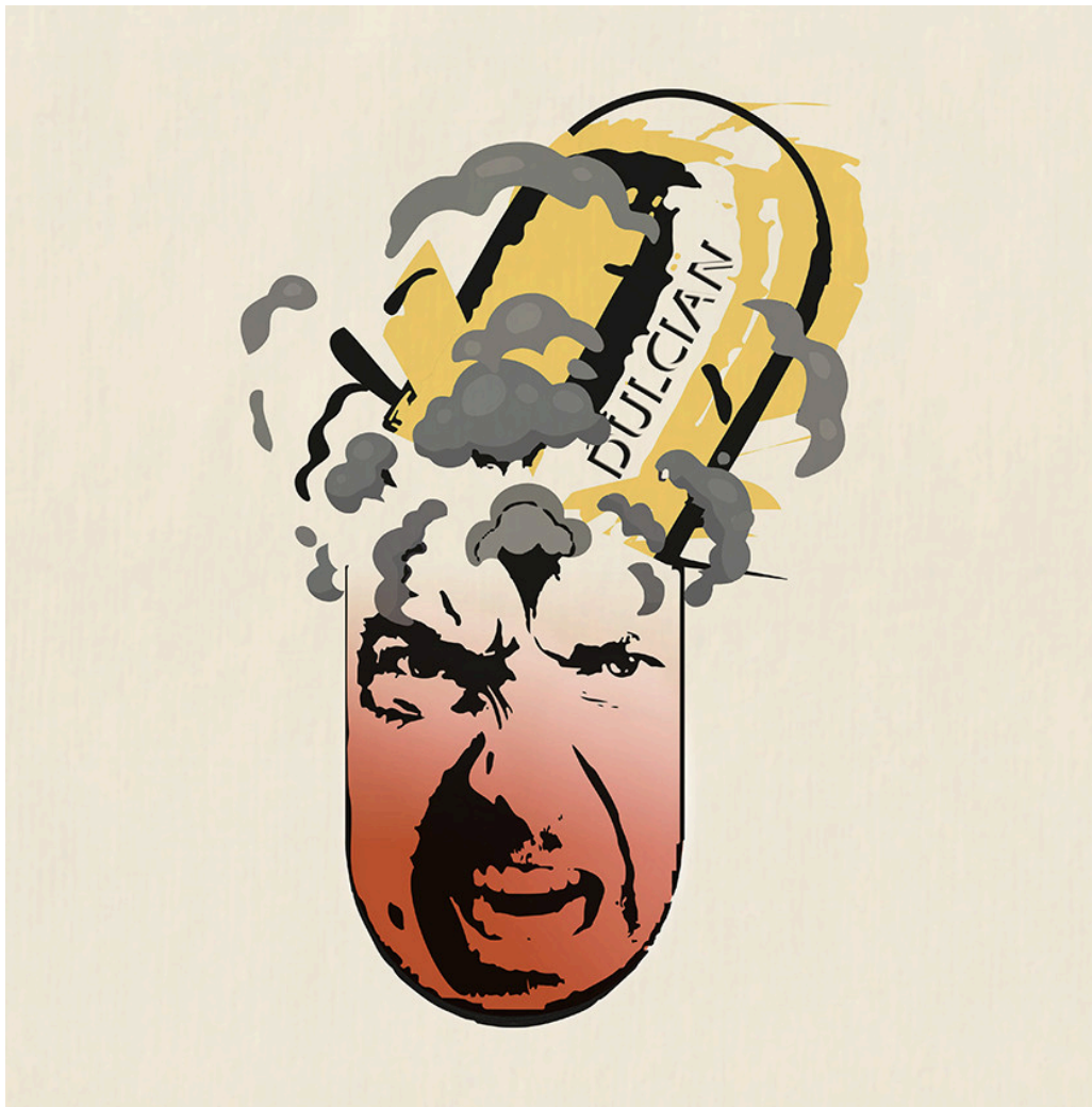
Figur 1 Den oppdiktede Dulcian-tabletten.