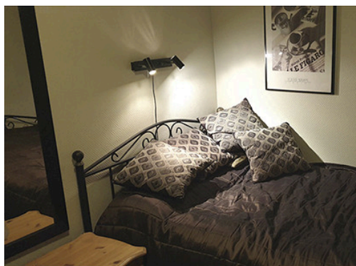
Synsinntrykk venstre øye

En ung kvinne hadde opplevd gjentatte episoder med kortvarig synstap på ett øye og ble henvist med spørsmål om transitoriske iskemiske anfall. Sykehistorien avslørte imidlertid at bakenforliggende årsak var et annet transitorisk fenomen.