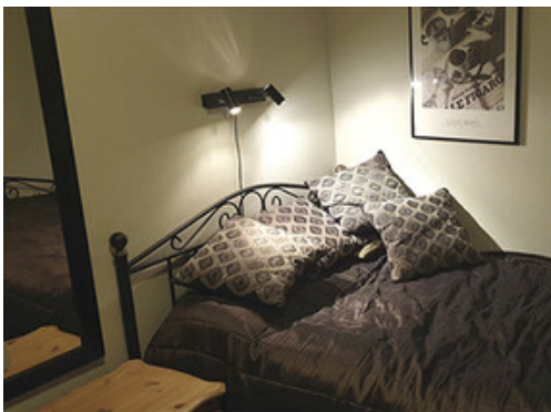
Synsinntrykk venstre øye

En ung kvinne hadde opplevd gjentatte episoder med kortvarig synstap på ett øye og ble henvist med spørsmål om transitoriske iskemiske anfall. Sykehistorien avslørte imidlertid at bakenforliggende årsak var et annet transitorisk fenomen.