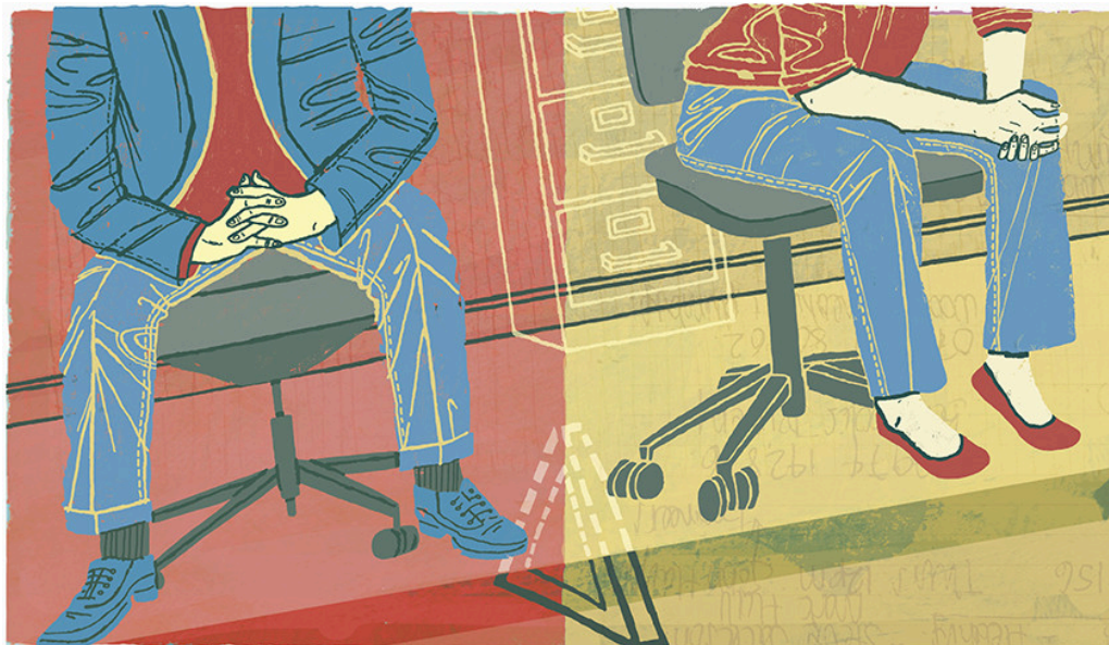
Figur 1 Illustrasjon: Eva Bee / NTB

Høy sysselsetting er en av suksessfaktorene bak den nordiske velferdsstaten. Men for dem som har falt ut av arbeidslivet, kan veien tilbake være lang. Det er på tide å tenke nytt om hva som skal til for å få flere tilbake i arbeid.