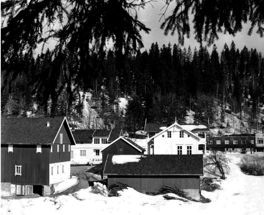
Figur 5 Epilepsisenteret på Solberg gård i Bærum i 1960-årene.

eneste sykehus for pasienter med alvorlig og vanskelig kontrollerbar epilepsi. Med sin historie er det et monument over det siste hundreårets rivende utvikling innen epilepsisorgen.