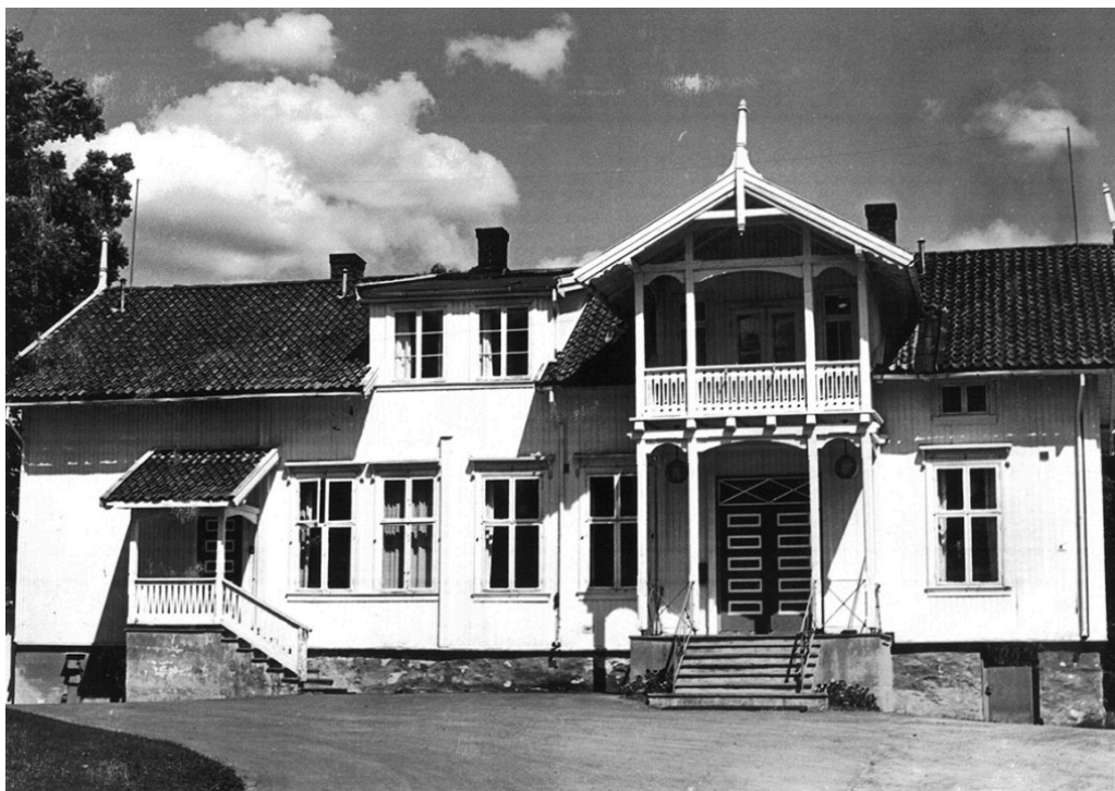
Figur 2 Solberg gård. Våningshuset er i dag revet og erstattet av et laboratoriebygg. Bilde fra ca. 1965.

Pasienter fra hele landet ble henvist til Solberg gård. Rundt 80 % av innleggelsene ble finansiert av det offentlige, hovedsakelig av det lokale fattigvesenet. De øvrige 20 % ble betalt av pårørende. Av og til skortet det på betalingsviljen, kanskje også evnen. Om en pasient som var innlagt fra februar 1913 til august 1914, heter det: «Faderen vilde ha ham hjem. Kunde ikke betale for ham i den dyretid.» Om en annen pasient som var innlagt et halvt år i 1914, står det: «flyttet hjem til moren igjen da Larvik fattigvesen ikke vilde betale lengre for ham.»