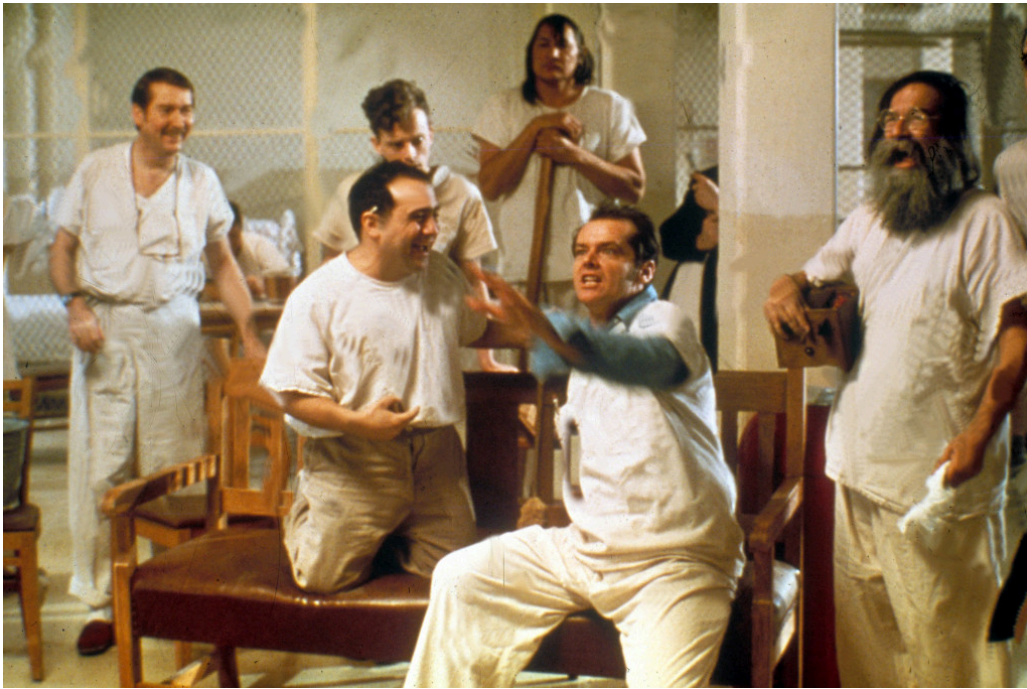
Gjøkeredet med Jack Nicholson i hovedrollen.

Ifølge Rosenhans artikkel la åtte friske frivillige (i framstillingen kalt pseudopasienter) seg på eget initiativ inn på 12 psykiatriske sykehus i fem amerikanske delstater. Alle rapporterte diffuse hallusinasjoner ved innleggelsen, og alle skulle i henhold til Rosenhans protokoll oppføre seg normalt under oppholdet. En pasient ble utskrevet med en manisk-depressiv diagnose, resten fikk en schizofrenidiagnose. Alle ble tungt medisinerert. En niende pasient ble utelatt fra studien, angivelig fordi han ikke holdt seg til forskningsprotokollen.