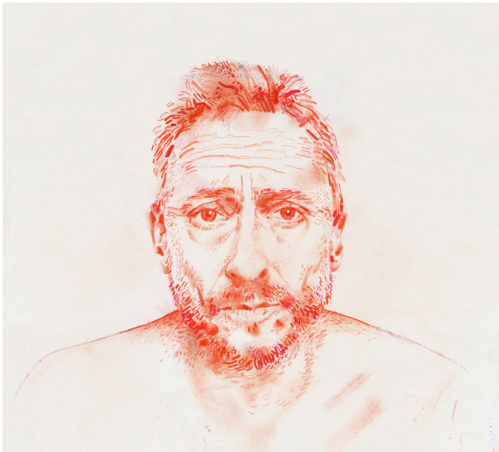
Illustrasjon: Derek Bacon Unplugged / NTB

Abramović forteller i sin biografi at hun erfarte umiddelbart at menneskene som satt mot henne, ble sterkt beveget, og hun opplevde en tilknytning til hver person ((7), s. 308–21). Følelsen av gjensidig ubetinget kjærlighet overfor fremmede var noe av det mest utrolige hun noensinne hadde opplevd.