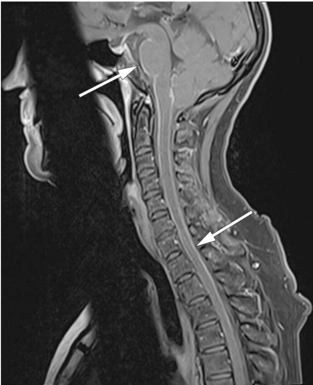
Figur 3 MR av cervicalcolumna. Sagittal T1-vektet sekvens med fettsuppresjon etter kontrasttilførsel avdekker markert leptomeningealt kontrastopptak infratentorielt og intraspinalt i cervikotorakalavsnittet.

Cerebrospinalvæskeundersøkelse ble gjennomført, tre måneder etter første innleggelse, med funn av leukocyttkonsentrasjon på 230 \cdot 10^6/l ( 0-4 \cdot 10^6/l ) hvorav 98 % var mononukleære, glukose på 2,6 mmol/l med cerebrospinalvæske-serum-ratio 0,35 ( > 0,6 ) og totalprotein på 3,12 g/l (0,00–0,45 g/l). Tester for Borrelia -IgG og -IgM var positive både i serum og cerebrospinalvæske, og resultat av IgG-ratiundersøkelse (ad modum Reiber med antistoffindeks \gg 1,5 ) var forenlig med intratekal Borrelia -IgG-produksjon og svikt i blod-hjerne-barrieren.