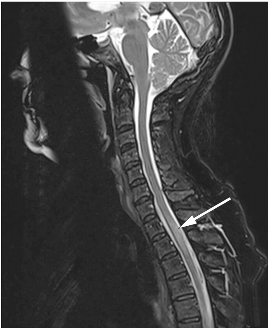
Figur 2 MR av cervicalcolumna. Sagittal T2-vektet sekvens avdekker nytilkomne høysignalforandringer i nivå Th1–Th3.

Man gjorde derfor kontrastforsterket MR-undersøkelse av medulla, som viste nytilkomne intramedullære forandringer forenlige med myelitt og meningitt (figur 2 og 3). På dette tidspunktet hadde det tilkommet diskrete trunkale sensoriske forstyrrelser og lett hyperrefleksi i underekstremitetene.