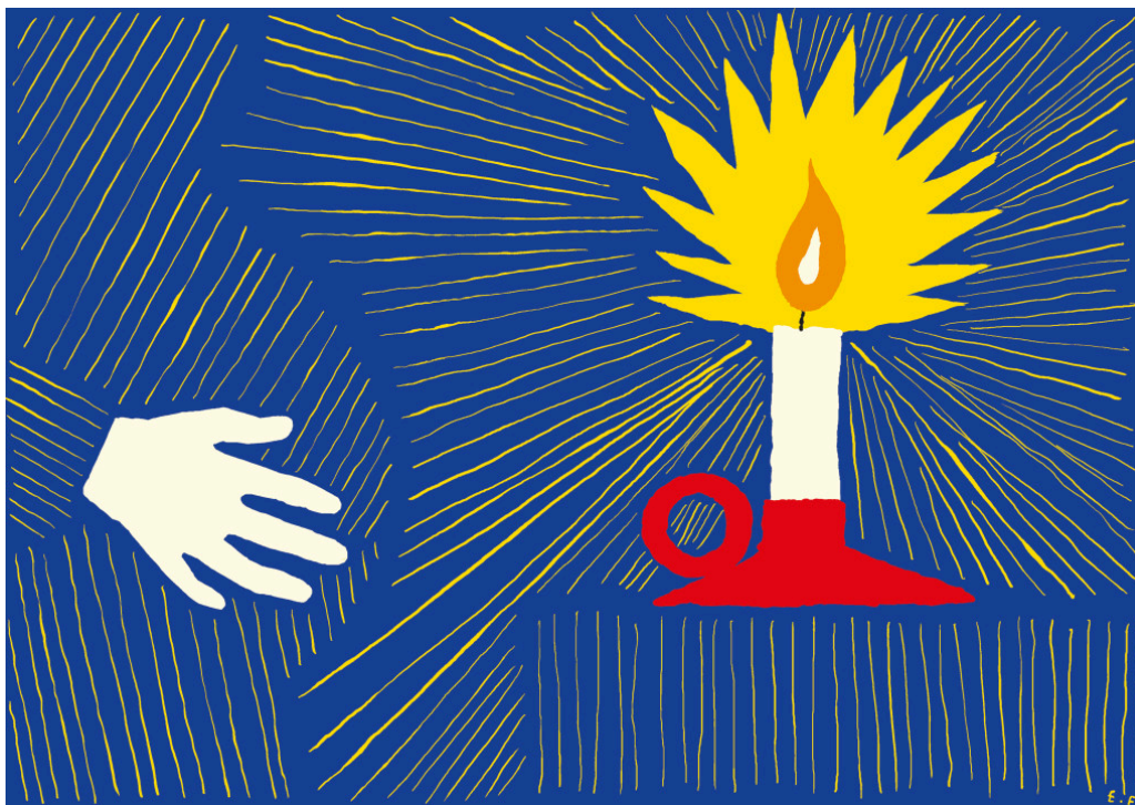
Illustrasjon: Espen Friberg

Valproat kom på markedet i Frankrike i 1967. Det er et av de mest effektive medikamentene for generalisert epilepsi, bipolar lidelse og migrene. Ettersom dette er hyppige sykdommer hos fertile kvinner, har valproat vært det tredje mest brukte antiepileptikum under graviditeten i Norden de siste 10–20 årene.