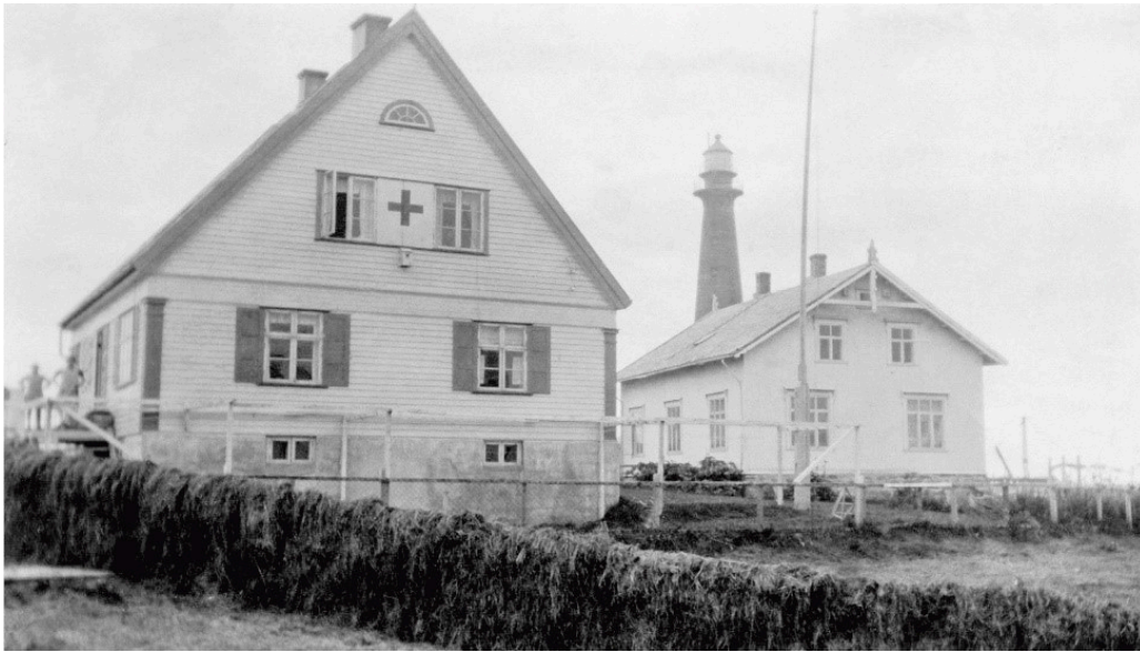
Røde Kors sykestue, Andenes.