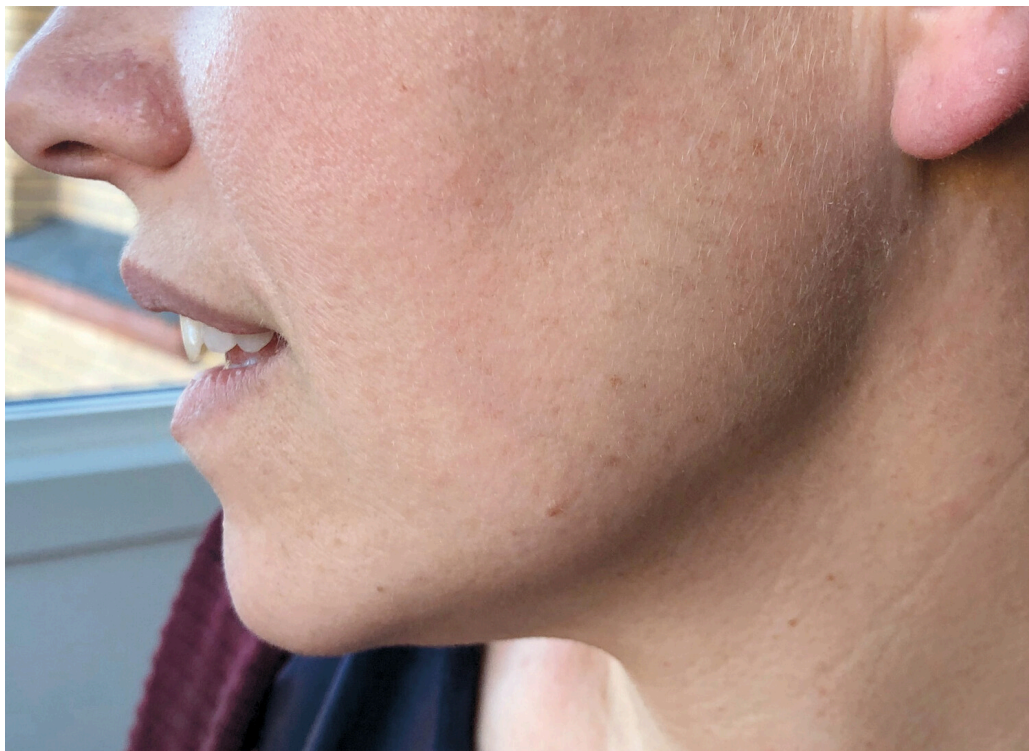
Figur 3 Diskrete fibrofollikulomer i ansikt.

Mens enkelte pasienter kun har noen få fibrofollikulomer, kan andre ha flere hundre lesjoner. Ablativ behandling kan vurderes hvis svulstene oppleves kosmetisk skjemmende, men de kan residivere.