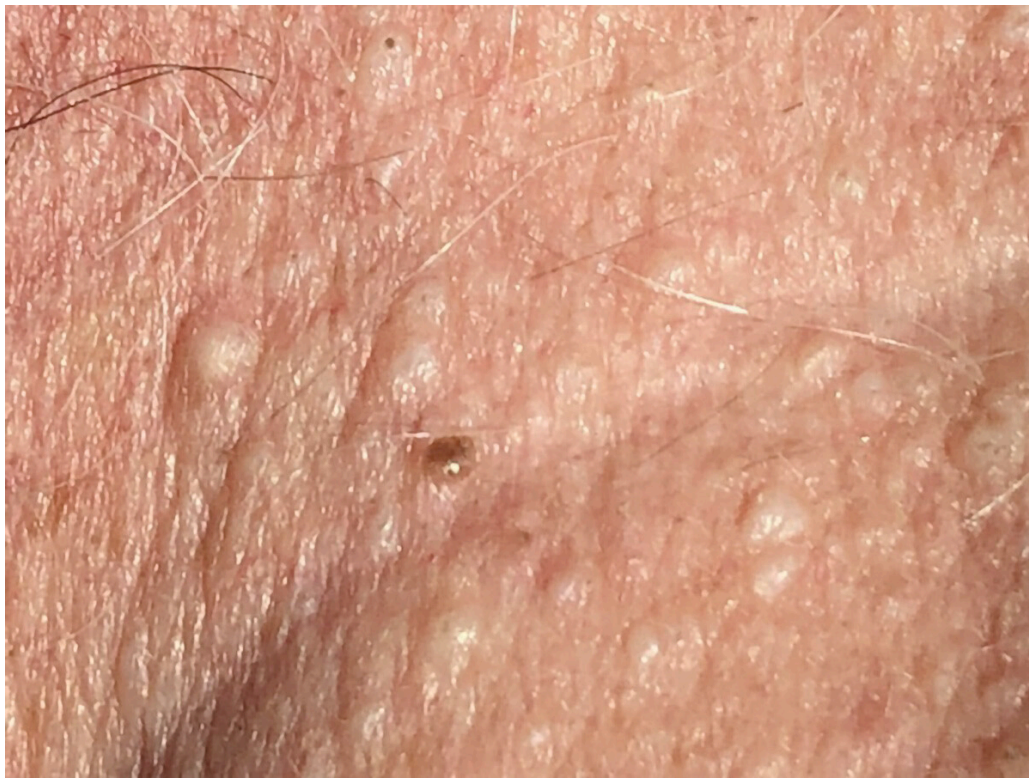
Figur 2 Fibrofollikulomer ved Birt-Hogg-Dubé-syndrom, nærbilde av nakke.