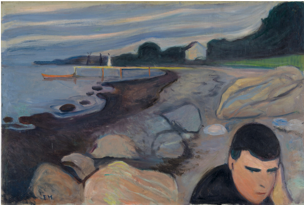
«Melankoli» av Edvard Munch fra 1892.

Sorg er ikke sykdom, men noen blir likevel syke av sorg. Freud var en av de første som forsøkte å forstå hvorfor.