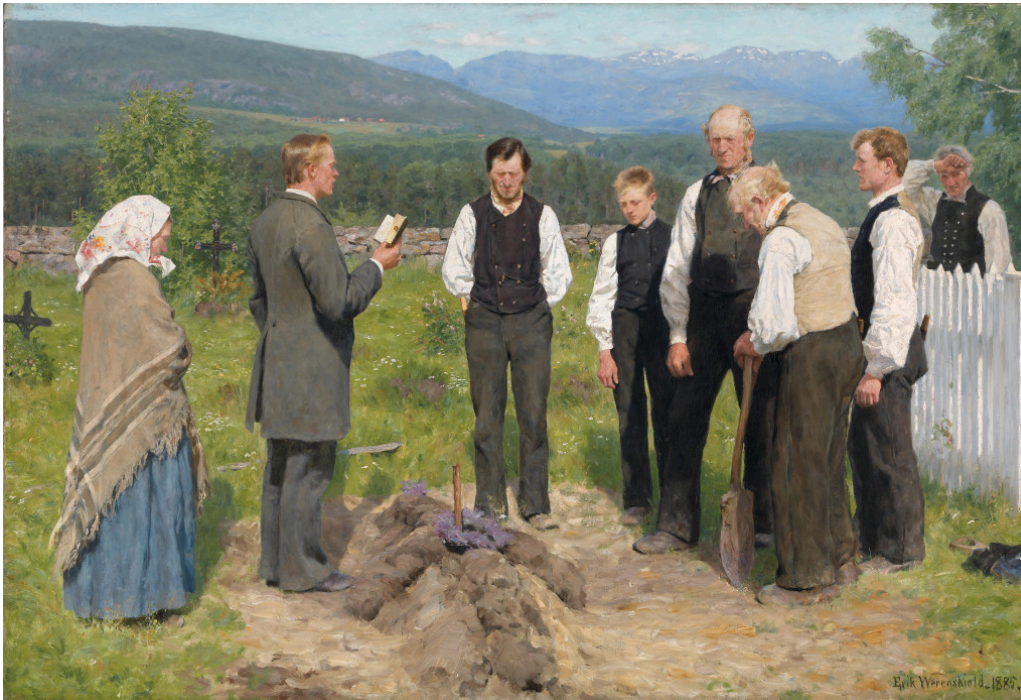
En påminning av viktigheten av ritualer i sorgarbeidet. «En bondebegravelse» av Erik Werenskiöld fra 1885.

Psykoanalytikerne Léon Wurmser og Otto F. Kernberg gir personlige beskrivelser av sorg etter sine ektefeller, som de hadde delt størsteparten av sitt liv med (15), s. 96, (17). De mener at Freud i for liten grad vektla de utviklingsmulighetene en gjennomarbeiding av sorgen medfører, også i høy alder.