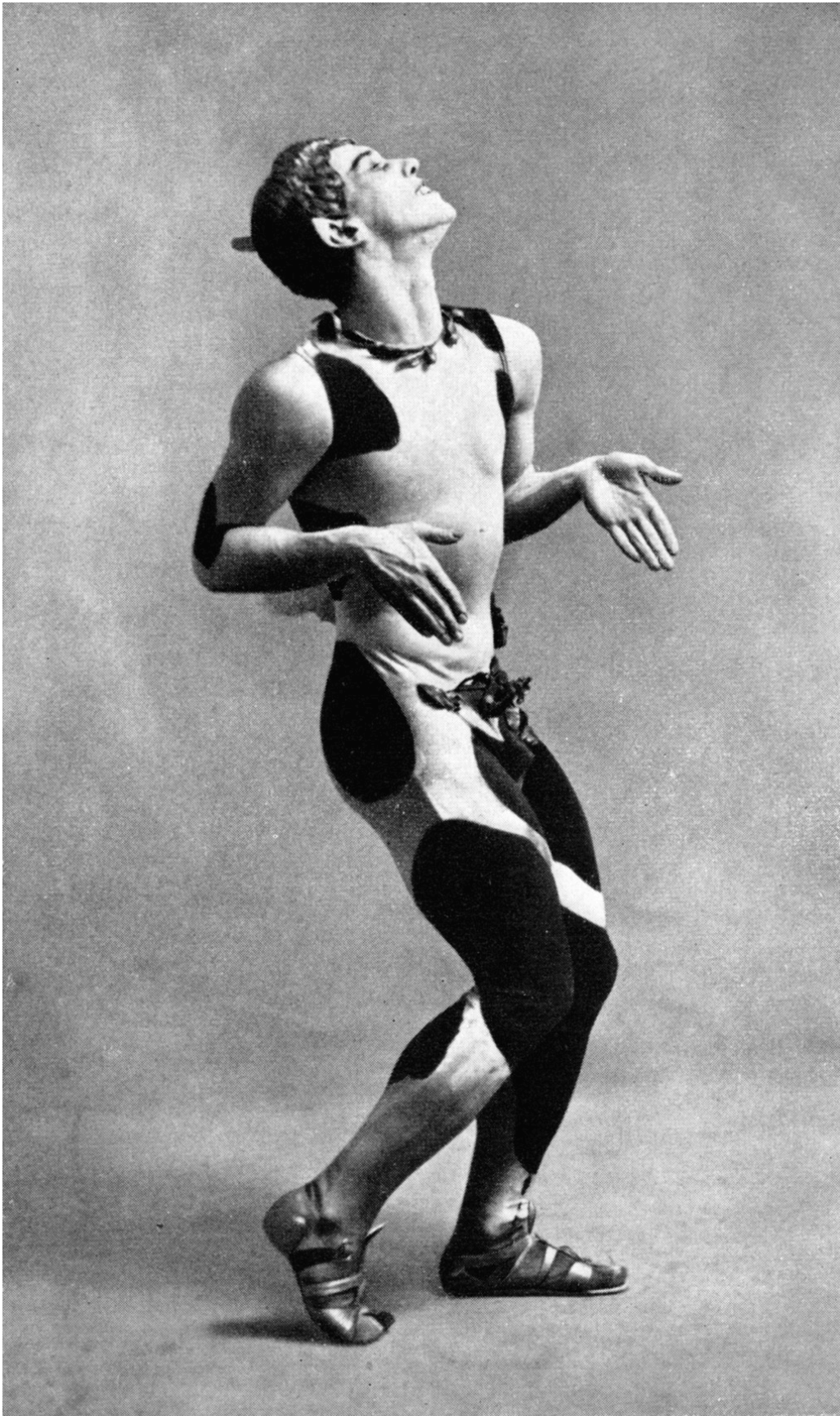
Nijinsky koreograferte og danset hovedrollen i Faunens ettermiddag i 1912, til musikk av Claude Debussy og dekor av Leo Bakst.

En annen synsvinkel er at han kan ha hatt en autismspekterforstyrrelse, sett ut ifra diagnosekriteriene i DSM-5 (13): Han snakket lite, manglet sosial intelligens, var passiv i relasjoner og hans eneste altoppslukende interesse var