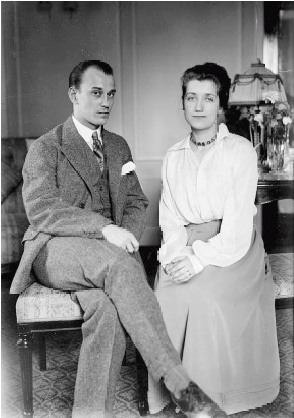
Nijinsky og kona Romola de Pulszky i 1916.

De første månedene der var Nijinsky gjentatte ganger voldelig, snakket ikke, var i ubevegelige stillinger, blottet seg, hørte stemmer og hadde vrangforestillinger. Han fikk diagnosen psykogen katatoni. Kona la seg stadig opp i behandlingen, og etter en tid tok hun han hjem for å pleie han selv. Da han ble gjeninnlagt fire måneder senere, var han klart forverret, med vekslende mellom stillstand og frenetiske bevegelser, plutselig vold, hallusinasjoner, vrangforestillinger og dårlig hygiene.