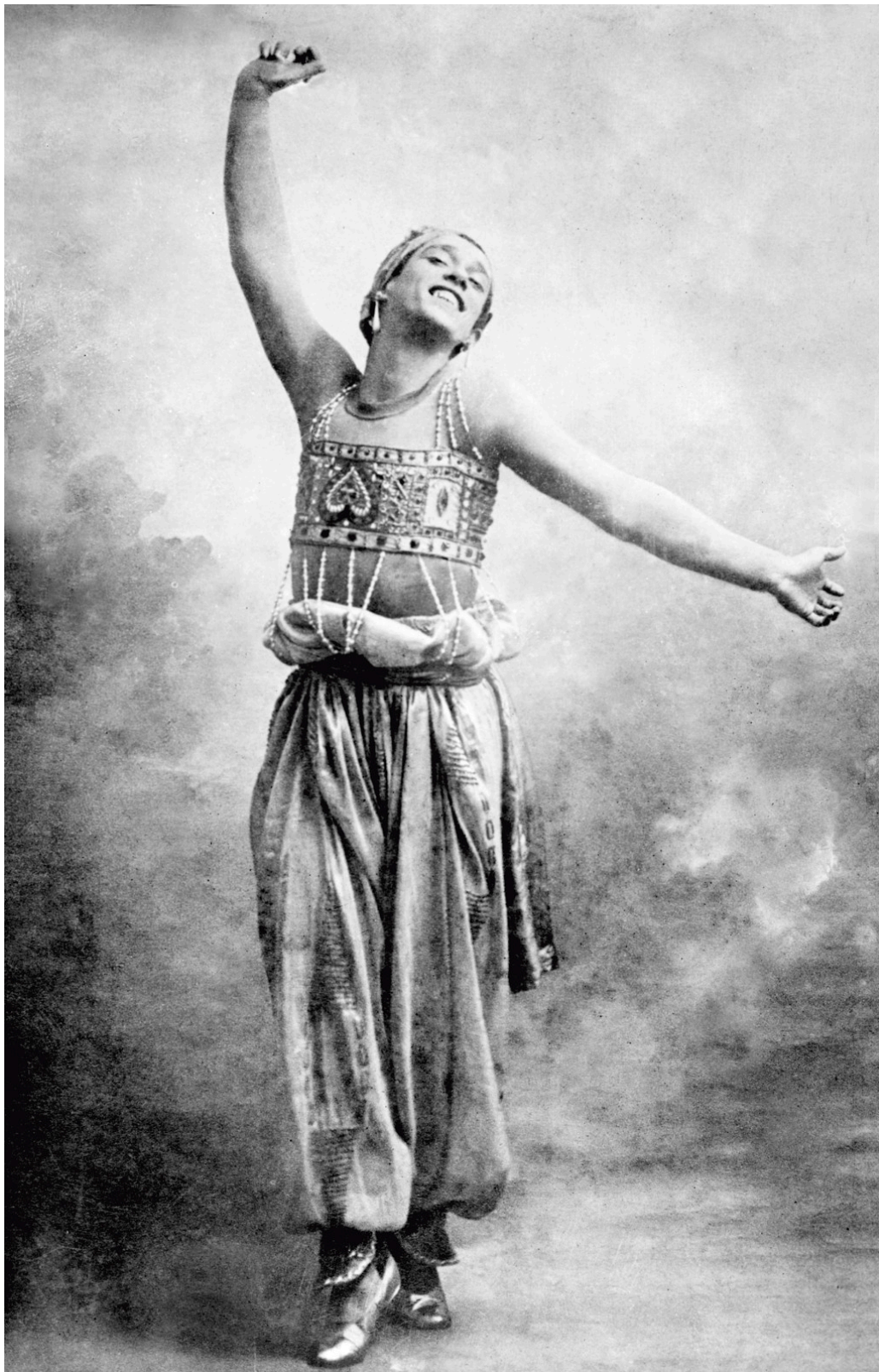
I ballettforestillingen Scheherazade fra 1910 spilte Nijinsky gullslaven, som var malt med og kledd i gull. Det erotiske stykket var kontroversielt ved å være en av de første gangene en orgie ble simulert på scenen.