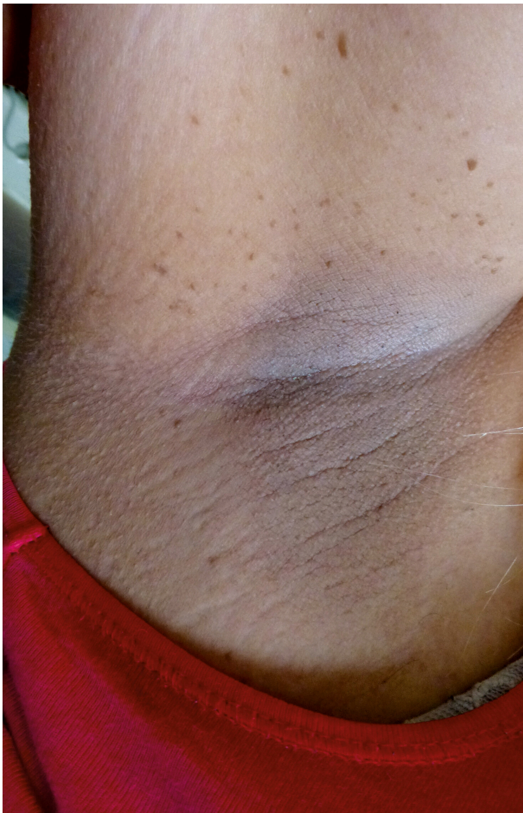
Figur 1 Pasienten hadde hyperpigmentering og fregner i armhulen.

En diagnose vi overveide var Fanconis anemi. Denne sykdommen opptrer klassisk med benmargssvikt i barnealder kombinert med typiske kliniske funn, spesielt skjelettanomalier i tommel eller radius og mikrokefali (4). Dette passet ikke hos vår pasient. Kortvoksthet, café-au-lait-flekker og fregner i armhulene kan sees ved Fanconis anemi, men er også typisk for neurofibromatose type 1, i likhet med relativ makrokefali. Neurofibromatose type 1 kunne imidlertid ikke forklare benmargssvikten, og sekvensering (cDNA-basert) av NF1 -genet tilknyttet denne tilstanden var normal. Vi avventet svar på genpanelet for