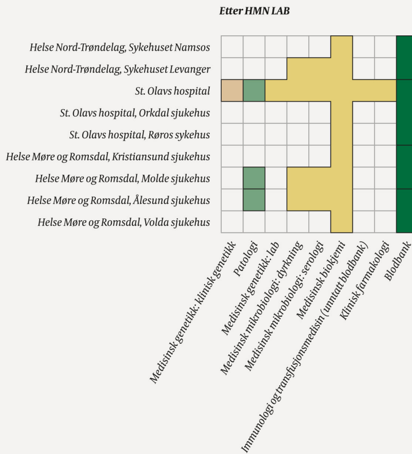
Figur 1b Her vises planlagt situasjon i 2020 etter fullført innføring av laboratorieløsningen Beaker. Som det fremgår av figuren, består endringene ikke bare av ny farge (nytt system), men også av færre vegger (= felles system).

■ SymPathy (Tieto) ■ ProSang (Databyråen) ■ iGene (Genial Genetics) ■ Beaker (Epic Systems Corporation) □ Rammene illustrerer separate installasjoner av programvaren