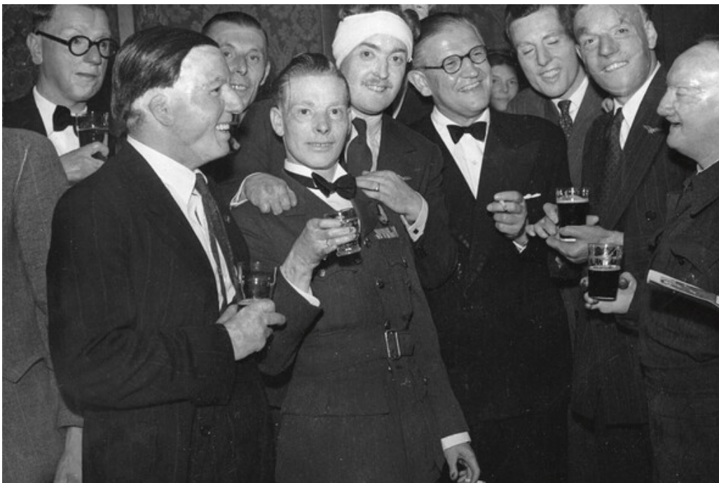
Figur 5 Gjenforening med The Guinea Pig Club og McIndoe.

The Guinea Pig Club fortsatte i tiden etter den annen verdenskrig. Klubben arrangerte årlige gjenforeninger og holdt kontakt livet ut (figur 5). Det var en klubb for samhold, støtte og kameratskap. Under en gjenforening i 1949 møttes 225 livsglade «forsøkskaniner» (guinea pigs), og det ble konsumert 3 000 flasker øl, 125 flasker whisky og 72 flasker sherry (7).