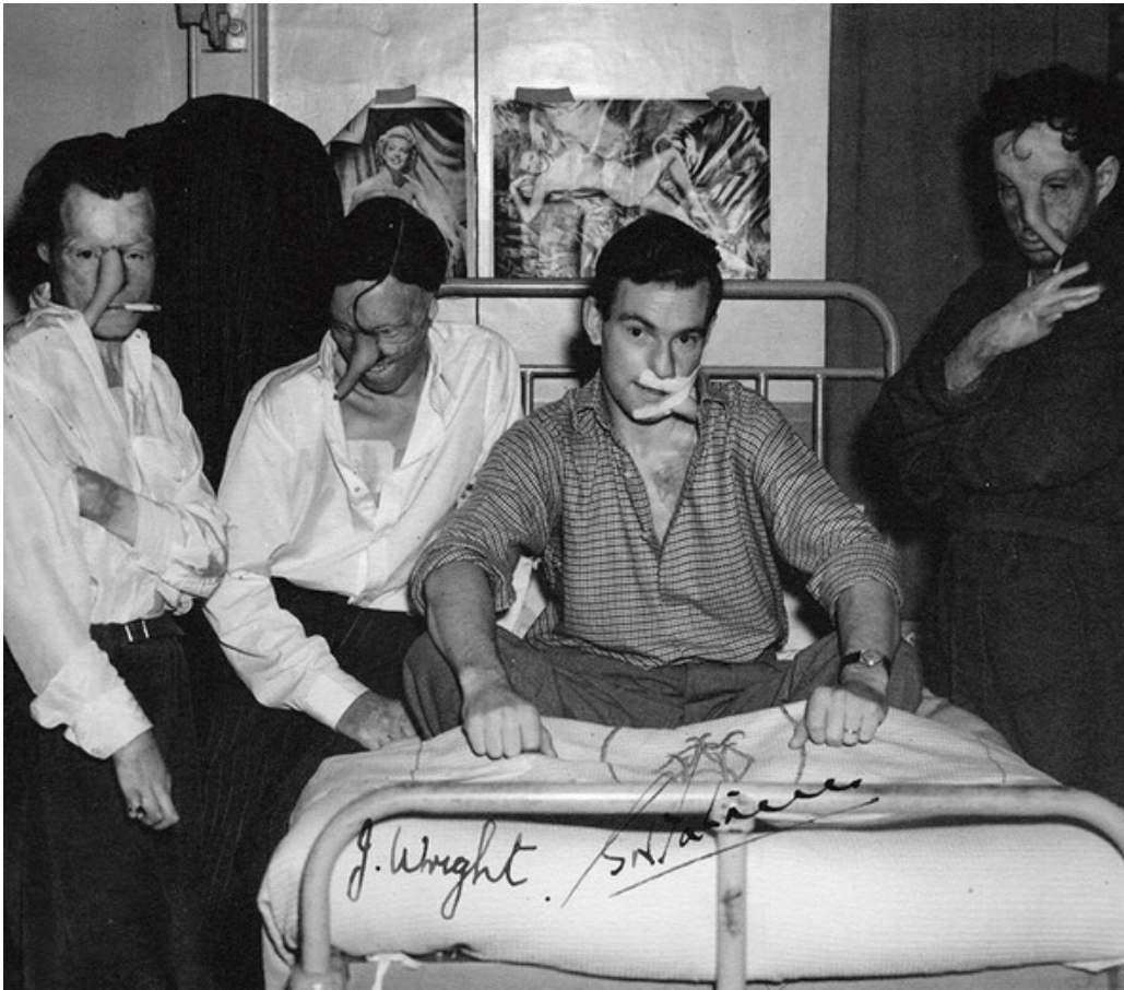
Figur 3 Pasienter med avstandslapper (trunks).