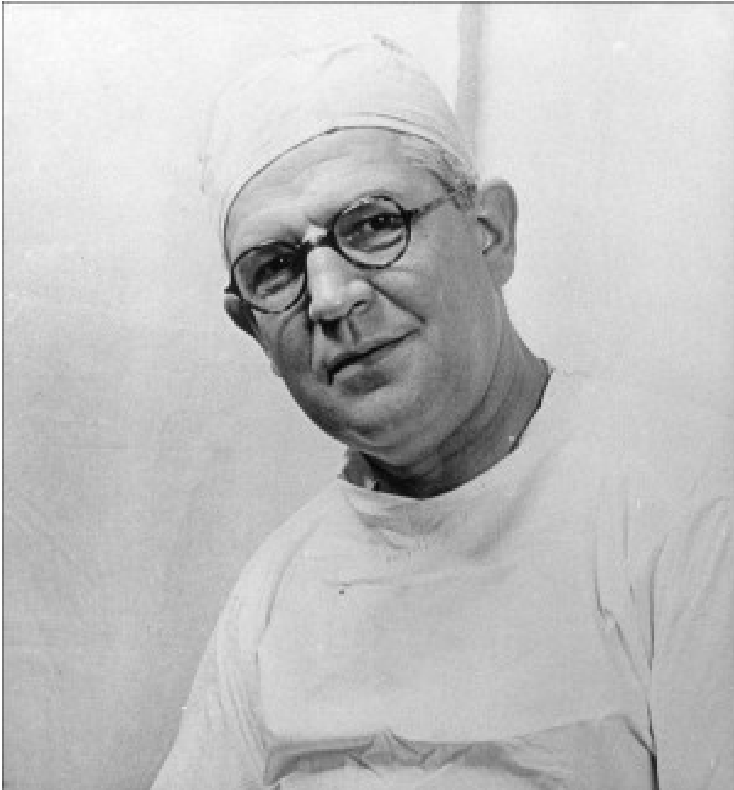
Figur 2 Sir Archibald McIndoe.

(sulfonamider) (3-6). Slik klarte de å redusere kontrakturdannning og oppnådde en sårbunn som var langt mer egnet for senere rekonstruksjon som for eksempel hudtransplantat. De nye prosedyrene minnet i stor grad om moderne brannskadebehandling (10).