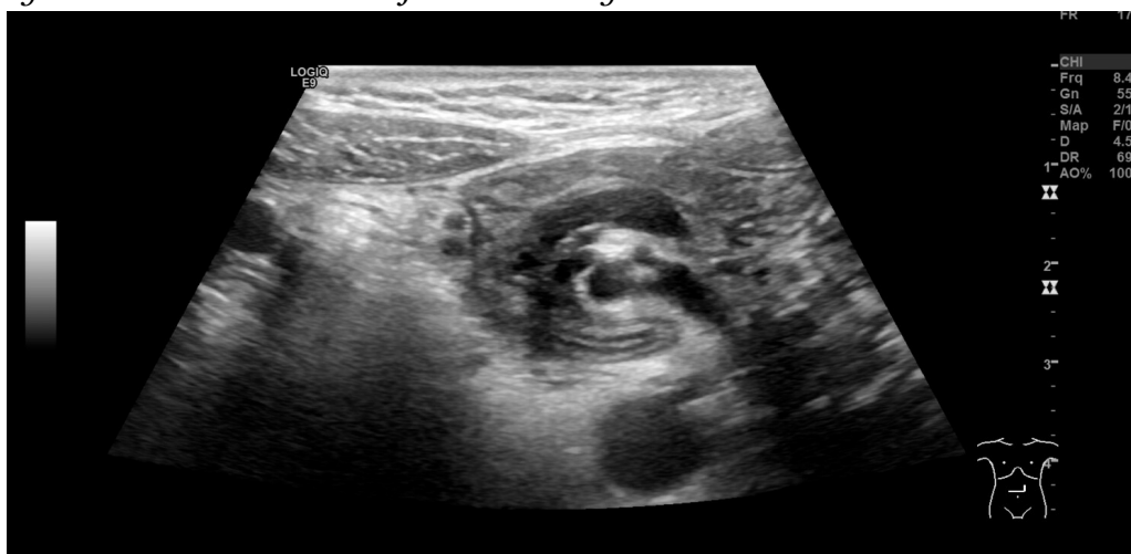
Figur 1 Ultralyd. Virvellignende rotasjon («whirl sign») som involverer kar og tynntarm i epigastriet.