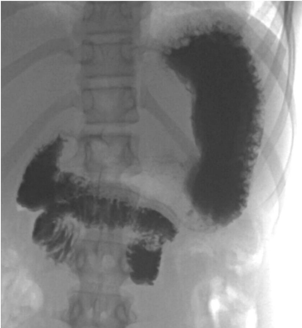
Figur 3 Røntgen øsofagus, ventrikkel og duodenum. Det er kontrast i ventrikkelen og spredt i duodenum som følger et typisk «korketrektermønster» i duodenum med manglende kontrastfylling til jejunum. Duodenum har atypisk beliggenhet, normalt ligger duodenum lenger oppad og til venstre for midtlinjen enn man ser her.