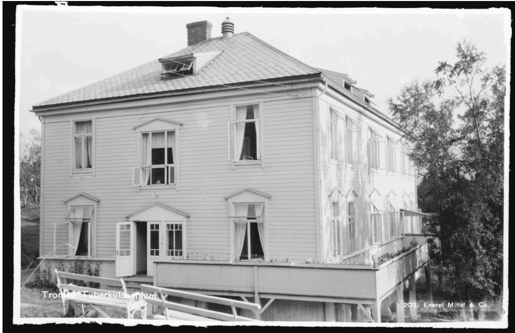
Tromsø Tuberkulosehjem, et av flere tuberkulosesykehus i fylket i den perioden.

opphold her igjen, fant overlegen det best å operere. Temp. var 37,5 i morges, og det er ingenting etter en operasjon.