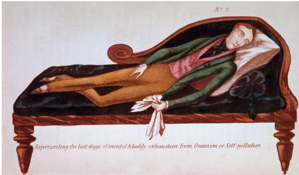
Figur 3 Onanist i svekkelsens siste fase, fra R.J. Brodies The Secret Companion fra 1845 (21). Wellcome Collection CC BY.

tok med nærmest alt man observerte av avvik i beskrivelsen. Det kan tyde på en erkjennelse av usikkerhet rundt årsakssammenhenger. De mange sykehistoriene innledes med en stikkordsmessig oppramsing av ulike «Indflydelser» Dahl mente var betydningsfulle i det enkelte kasus, for eksempel «Drukkenskap, Fortvivlelse, Selvmordsforsøg og Mordforsøg; Sengeleje i 21 Aar, af og til med Raseri. Forrykthed, Hallucinationer.» ((2), s. 129). I noen tilfeller antar de nærmest poetisk form: «Kjærlighetssorg, stille Forvirring; Omgangslægd, Raseri» ((2), s. 149).