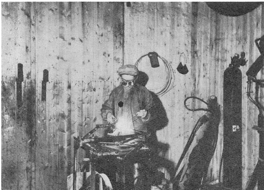
Fra sykkelreparasjonsverksted. Sykkelramme. Autogensveisning.

Det vanskeligste punkt vil dog være å få bort den sinkdamp som fyller rummet under selve støpningen, fordi denne foregår avvekslende på forskjellige steder i rummet. Denne vanskelighet kan undgås ved at arbeiderne lar støpningen foregå ved siden av smelteovnen under avtrekket eller ekshaustoren. På den måte er flere messingstøperier blitt befridd for sinkfeberen (Fischer). Men den mest effektive anordningen er flyttbare og dreibare eksaustorer. Da kan støpningen foregå hvor som helst i rummet, og man kan alltid få god ventilasjon. (...)