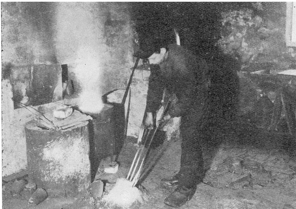
Det smeltede metall i diglen «skummes» for slag og urenheter.

Sinkdampen har en lett stikkende lukt, minnende om saltsyre, smaken er ubehagelig, søtlig. Etter \frac{3}{4} time merkedes tetthet i nesen, tørrhet i halsen og en tørr kratsende hoste. Bortsett herfra følte jeg meg helt frisk. Da to timer var gått, kjørte jeg hjem og var så optatt med kontorarbeide.