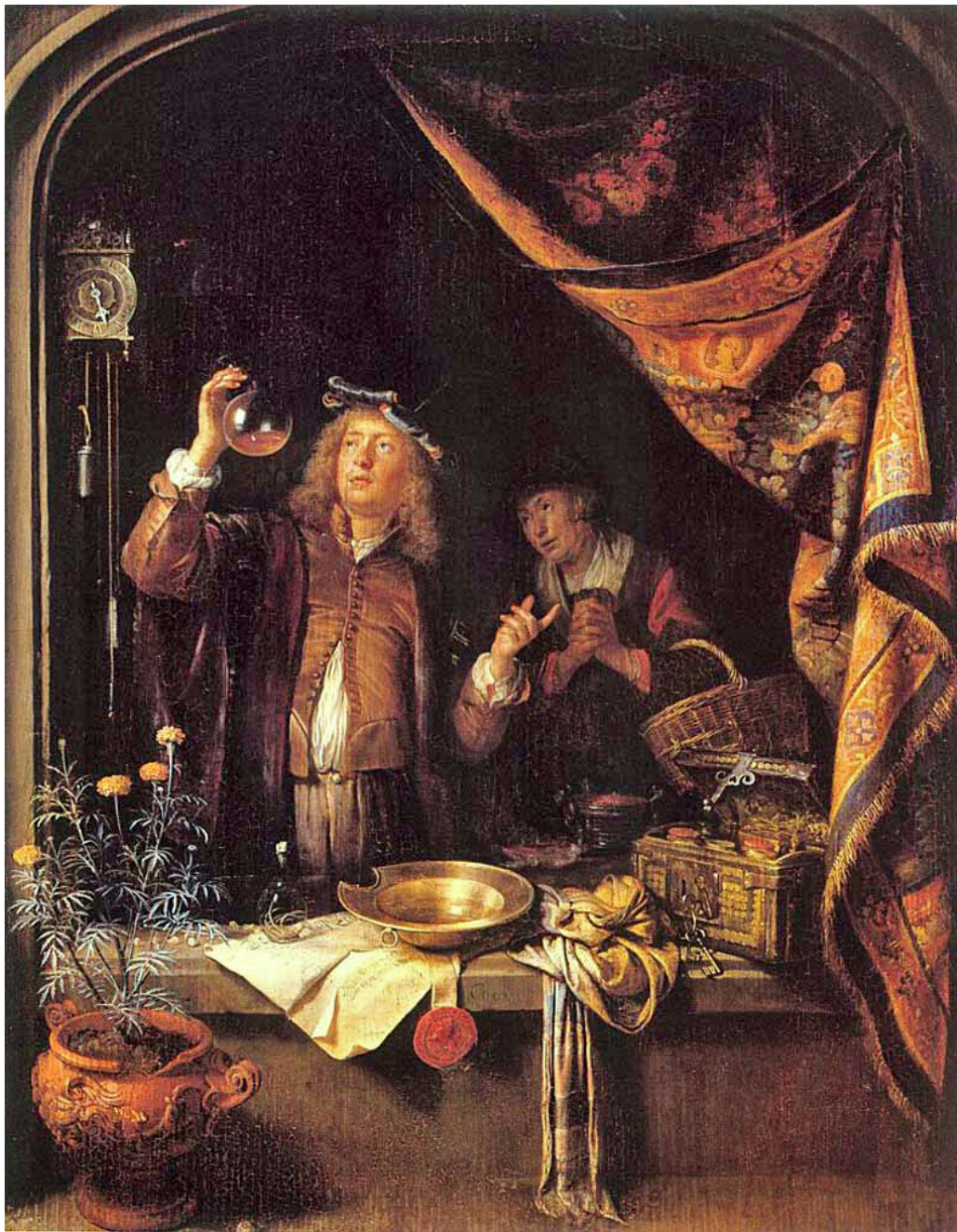
Figur 3 Gerrit Dou (1613–1675). «En lege studerer urin».