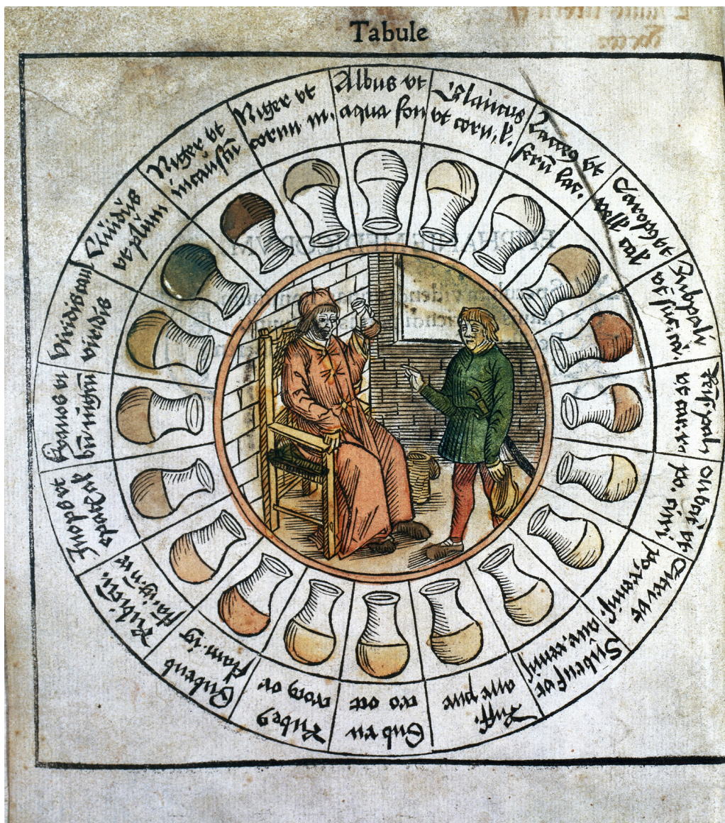
Figur 2 Det såkalte urinhjulet, med en fargeskala som får en til å tenke på moderne urinstiks.

Etter hvert fikk uroskopian status som legenes viktigste diagnostiske redskap, noe som representerte et brudd med den antikke tradisjonen, hvor anamnesen og klinisk undersøkelse var viktigere. Uroskopi ble selve innbegrepet av medisinsk praksis, og matulaen ble det ikoniske kjennetegnet på legen, omtrent som stetoskopet i våre dager. I tallrike kunstverk fra 1500- og 1600-tallet er legen avbildet mens han tankefullt studerer dette symbolsk viktige instrumentet (fig 3) (17).