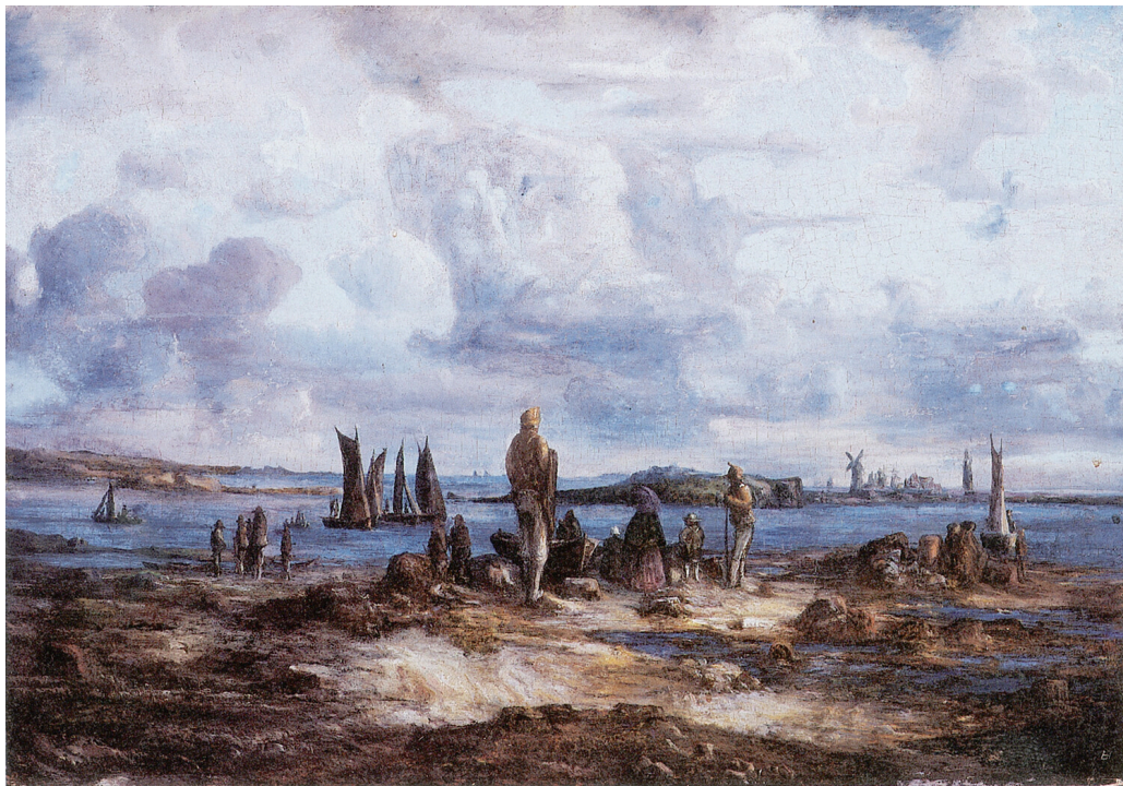
Figur 3 Lars Hertervig: Vårsildfiske. 1860-årene. Eies av Nasjonalgalleriet, Oslo

Hertervig frembrakte kunst av høyeste klasse, til tross for sin sykdom. Man kan vel kanskje tilføye: muligens, til tross for sin sykdom. Man kan vel kanskje tilføye: muligens også på grunn av sin sykdom. I sin isolasjon har han kanskje levd sterkere og mer intenst i sin indre verden. Stemninger har kanskje vært brutt som har fått ham til å se og oppleve en verden de fleste av oss bare får et glimt av. Kanskje har sykdommen, i hvert fall i den mer produktive fase, beriket hans kunst?