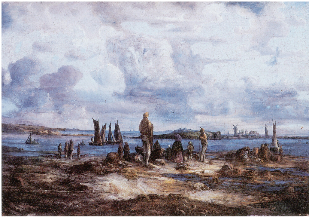
Figur 3 Lars Hertervig: Vårsildfiske. 1860-årene. Eies av Nasjonalgalleriet, Oslo

Hertervig frembrakte kunst av høyeste klasse, til tross for sin sykdom. Man kan vel kanskje tilføye: muligens, til tross for sin sykdom. Man kan vel kanskje tilføye: muligens også på grunn av sin sykdom. I sin isolasjon har han kanskje levd sterkere og mer intenst i sin indre verden. Stemninger har kanskje vært brutt som har fått ham til å se og oppleve en verden de fleste av oss bare får et glimt av. Kanskje har sykdommen, i hvert fall i den mer produktive fase, beriket hans kunst?