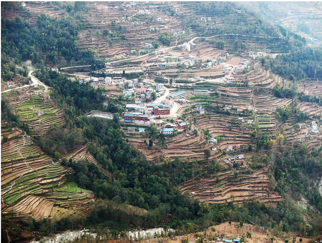
Figur 1 Okhaldhunga sykehus ligger i dalsiden med terrassejordbruk på alle kanter. Her er spredt bebyggelse, men sykehuset betjener en befolkning på mer enn 250 000 mennesker.

Det lille Okhaldhunga sykehus i Øst-Nepal (6) ligger i landlige omgivelser med spredt bebyggelse (fig 1). Jeg har jobbet her de siste 14 årene. Sykehuset har nå godt over tusen fødsler årlig, men vi ser fremdeles katastrofale følger av at gravide ikke får kvalifisert hjelp i tide. Mye av problemet har vært at de har satset på å la fødselen skje hjemme. Svære postpartumblødninger forårsaker alene 25–30 % av mødredødsfallene her i Nepal (7), omtrent som i de fleste fattige land i Asia og Afrika (8). I en befolkning på vel 250 000 mennesker i Okhaldhunga distrikt utgjør dette alene flere dødsfall årlig. Obstruert fødsel på grunn av mekaniske misforhold eller udiagnostisert avvikende leie er også vanlig. For dem som ikke når sykehus i tide, kan det føre til livsvarige iskemiskader hos barnet eller fosterdød, eventuelt også uterinruptur og risiko for mors liv. Her er vi ved sakens kjerne: Hvordan kan vi, i en del av verden der mødredødeligheten er høy og transport er dyrt og langsomt, sikre at fødende kvinner når sykehus i tide?