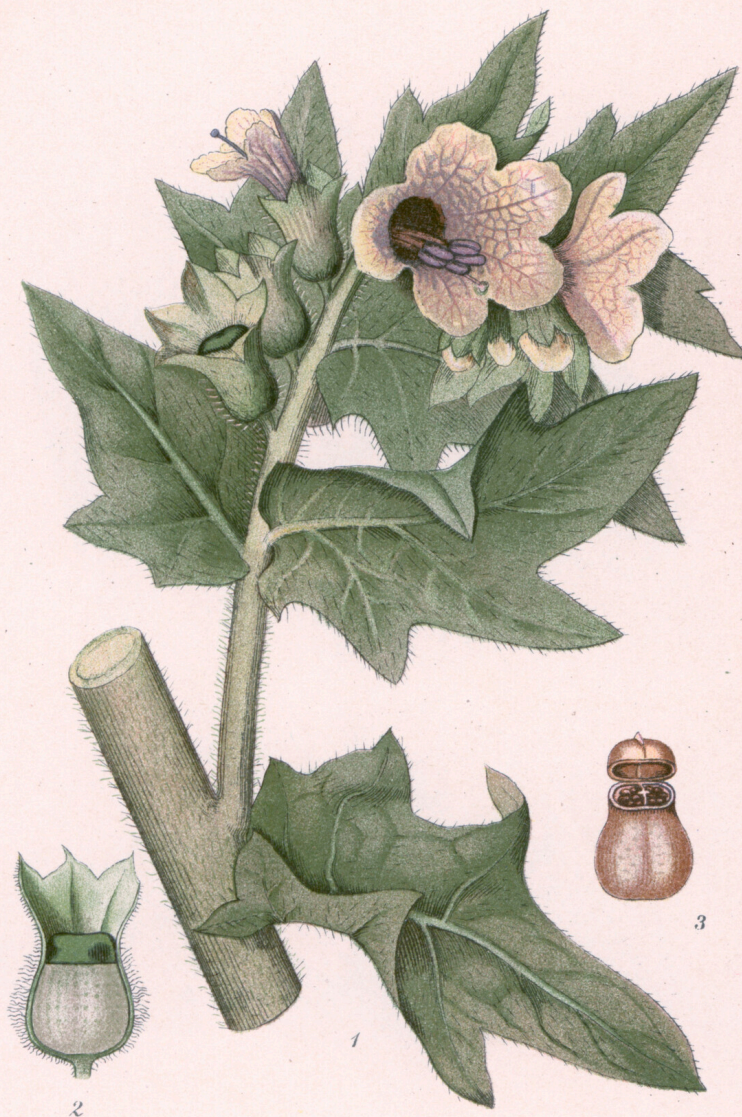
BOLMÖRT, HYOSCYAMUS NIGER L.