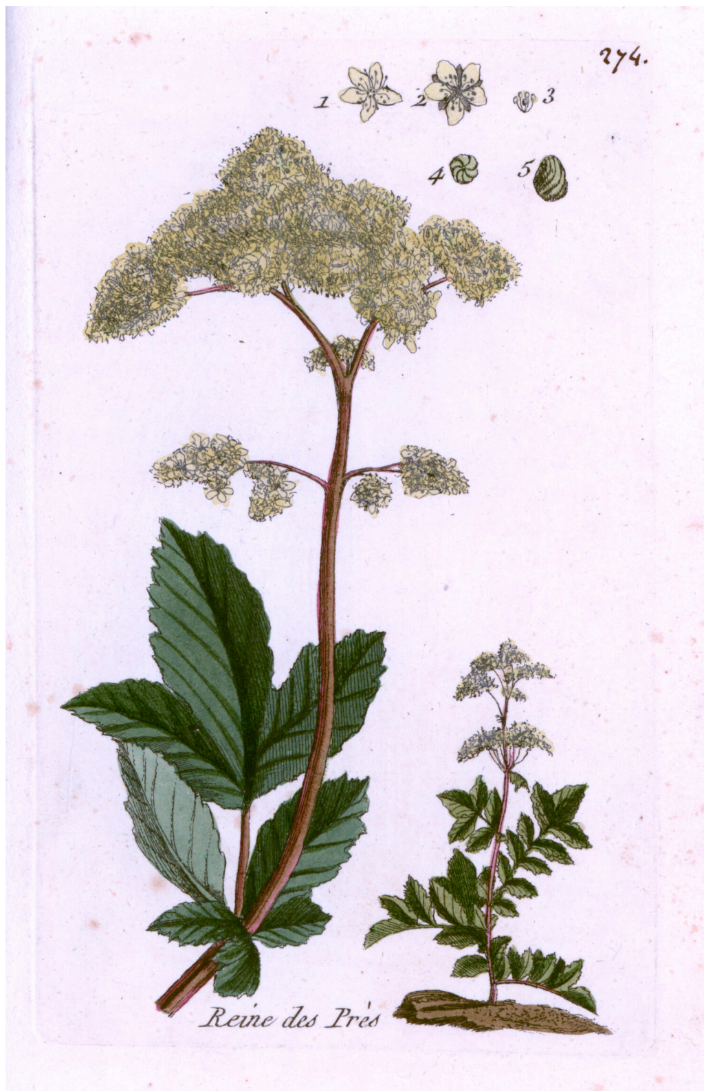
Mjødurt, Filipendula ulmaria , fransk «engdronning». Håndkolorert gravering av Pierre Bulliard fra «Flora Parisiensis», 1776.

Acetylsalisylsyre ble et av historiens mest fremgangsrike legemidler og er fortsatt en hjørnestein i antitrombotisk behandling. Som smertestillende medikament har det imidlertid mistet sin betydning og er blitt erstattet av nyere NSAID-midler. I moderne postoperativ smertebehandling brukes gjerne COX-2-selektive hemmere, som kan betraktes som den yngste arvtageren til pilebarken (23).