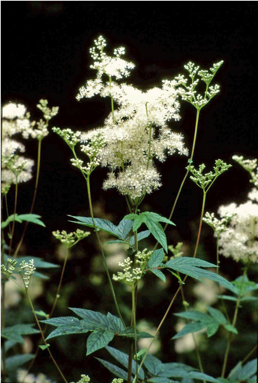
Mjødurt, Filipendula ulmaria , fotografert ved Kolsås i Bærum. Det tidligere latinske navnet Spiraea ulmaria ga inspirasjon til navnet aspirin. Mjødurt inneholder salisylater.