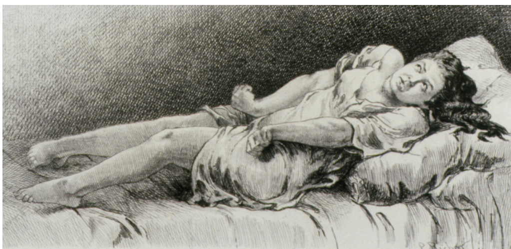
Epilepsi i første stadium – paralyse og krampe. Etsning etter en tegning av Paul Richer i hans «Etudes cliniques sur la grande hystérie ou hystéro-épilepsie» fra 1885.

Valproat kom på markedet for første gang i 1967 og fikk snart stor utbredelse, særlig i Europa. Pussig nok tok det flere år før det ble lisensiert i USA – ifølge onde tunger fordi det ikke var utviklet i Statene (NIH, forkortelsen for den store amerikanske forskningsinstitusjonen National Institutes of Health, ble sarkastisk lest som «not invented here») (7) .