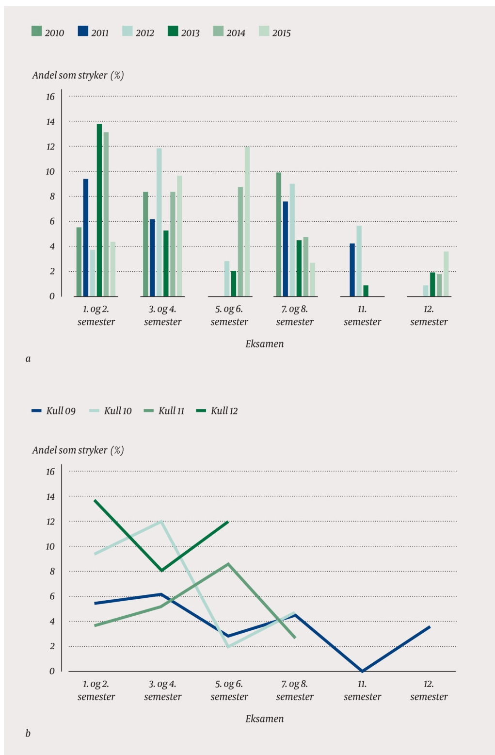
Figur 1 a) Andel av medisinstudenter som har strøket til eksamen hvert studieår ved Norges teknisk-naturvitenskapelige universitet 2010–15 ved bruk av dagens metode for standardsetting med 65 % beståttgrense. b) Andel stryk (%) til fire kull fulgt over tid, kull 09 startet i 2009, kull 10 i 2010 osv. X-aksen viser hvilken eksamen data er hentet fra, mens Y-aksen viser antall stryk i prosent