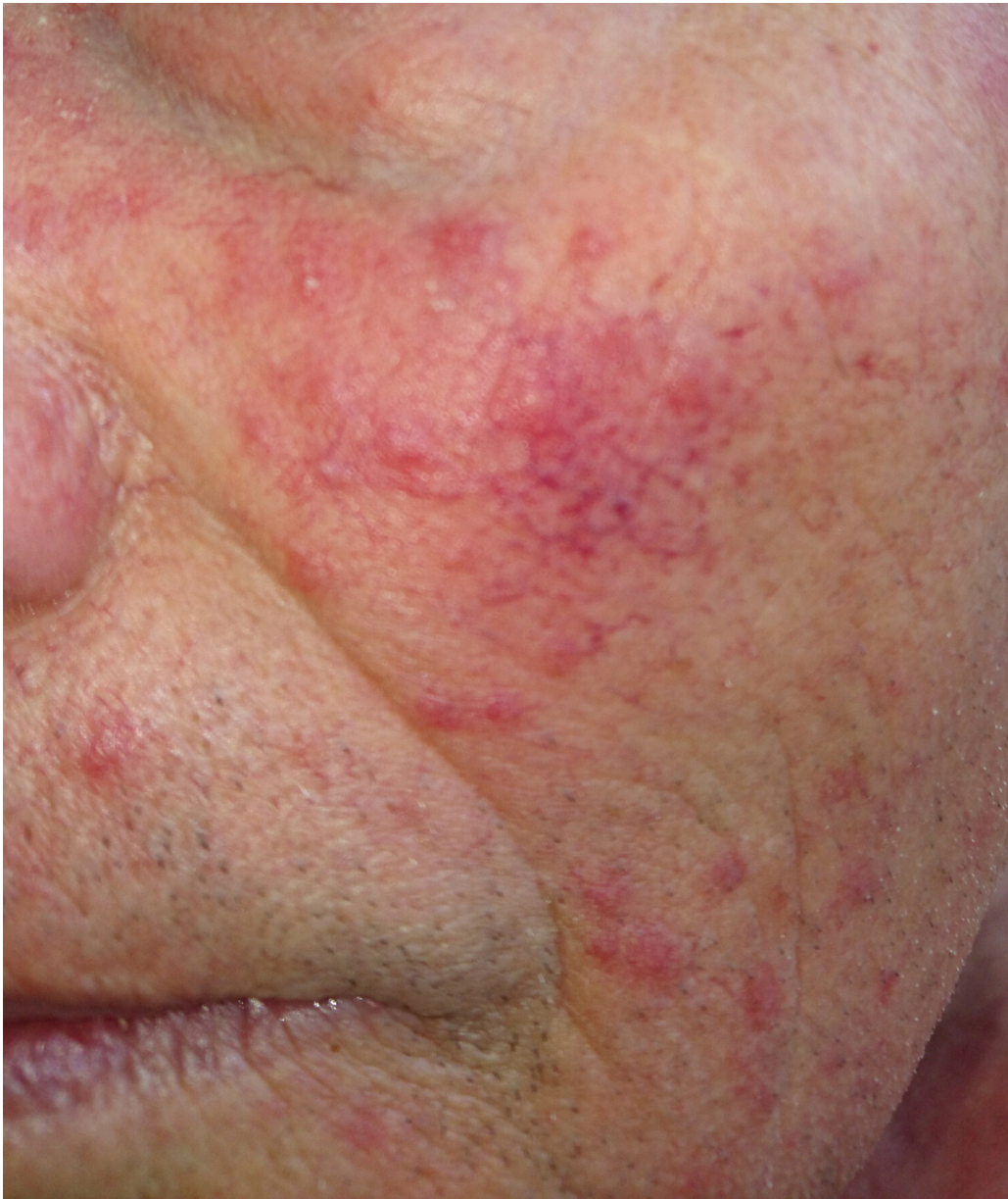
Figur 2 Papulopustuløs rosacea