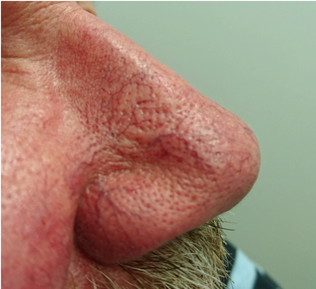
Figur 3 Fymatøs rosacea