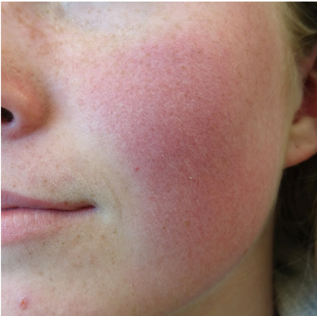
Figur 1 Erytematøs teleangiektatisk rosacea

Rosacea kan klassifiseres i fire kliniske subtyper (3): erytematøs teleangiektatisk rosacea, papulopustuløs rosacea, fymatøs rosacea og okulær rosacea (fig 1–4). De kliniske manifestasjonene kan gli over i hverandre, og det histopatologiske bildet er uspesifikt.