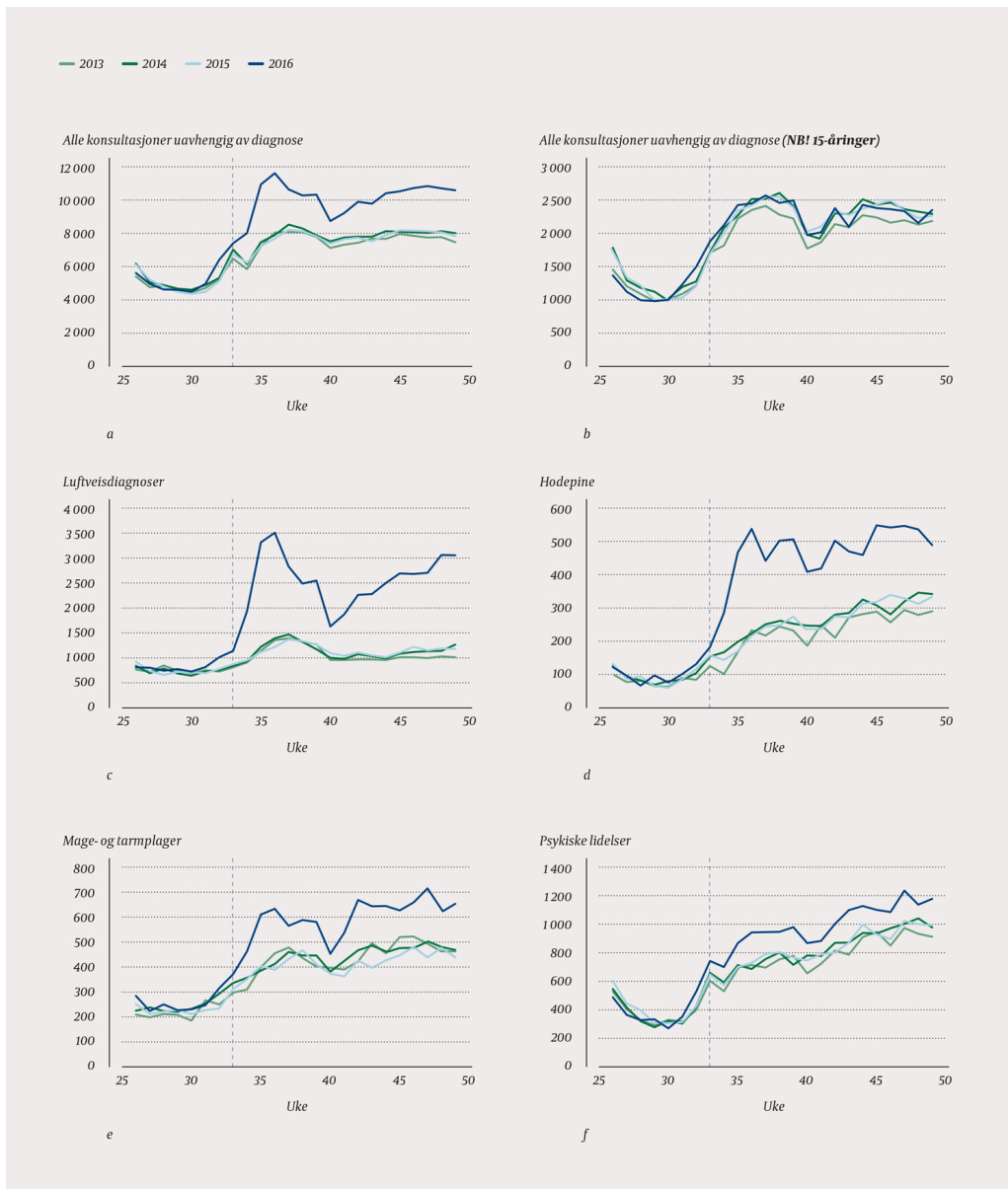
Figur 1 Antall konsultasjoner i allmennlegetjenesten per uke i årene 2013–16 (aldersgruppe 16–18 år om ikke annet er angitt). a) Alle konsultasjoner. b) Alle konsultasjoner i aldersgruppen 15 år. c) Luftveisinfeksjoner. d) Hodepine. e) Mage- og tarmplager. f) Psykiske lidelser. Stiplet linje markerer uke 33 som ofte er uken for skolestart (midten av august)

Luftveisinfeksjoner var hyppigst forekommende diagnosegruppe alle år (tab 3, fig 1c). I perioden 2013 – 15 var antall konsultasjoner for luftveisinfeksjoner hele tiden under 1 500 per uke, mens det i 2016 var en betydelig økning, med 3 492 som høyeste registrerte antall i uke 36. Konsultasjonsraten for luftveisinfeksjoner var 23,2 per 100 personer høsten 2016 mot 10,5 per 100 året før, noe som svarte til mer enn en fordobling (IRR 2,21, 95 % KI 2,17 – 2,25), se tabell 3.