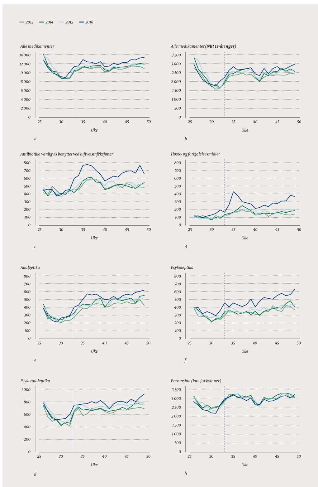
Figur 3 Antall uttak av reseptpliktige legemidler per uke i årene 2013–16 (aldersgruppe 16–18 år om ikke annet er angitt). a) Alle legemidler. b) Alle legemidler i aldersgruppen 15 år. c) Antibiotika, typer vanligvis benyttet ved luftveisinfeksjoner. d) Hoste- og forkjølelsemidler. e) Analgetika. f) Psykoleptika. g) Psykoanaleptika. h) Prevensjon. Stiplet linje markerer uke 33 som vanligvis er uken for skolestart (midten av august)

Uttak av legemidler innenfor legemiddelgruppene analgetika (ATC-kode N02) var også høyere høsten 2016 sammenlignet med tidligere år (tab 3, fig 3e), og det samme gjaldt psykoleptika (ATC-kode N05) (tab 3, fig 3f). For legemiddelgruppen psykoanaleptika (ATC-kode N06) kan det se ut til at det er